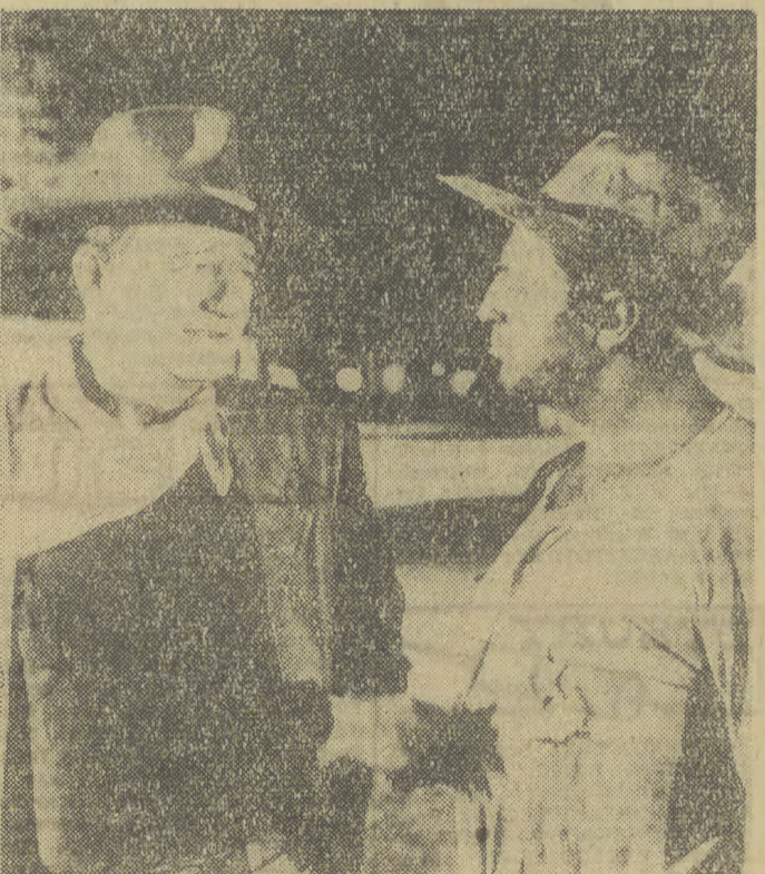
John Wayne w jednej ze scen filmu

Jeden z Czytelników, mieszkaniec Swoszowic, pisze nam o kłopotach w swoim miejscu zamieszkania. „W odcinku rozwidlenia drogi w Swoszowicach, nadal znajduje się styczny „zakręt śmierci”. W ciągu ostatniego półroczu zanotowano tu trzy wypadki śmiertelne. Myślę, że można by przynajmniej oświetlić ten niebezpieczny zakręt i ustawić znak ograniczający szybkość. Innym kłopotem są stałe awarie wysokiego napięcia i związane z tym długie przerwy w dopływie prądu. Nie możemy korzystać z telewizorów, lodówek, hydroforów. Mieszkańcy Swoszowic skarżą się również na brak automatu telefonicznego. Nie można w razie potrzeby wezwać pogotowia lekarskiego czy milicji. (3638)