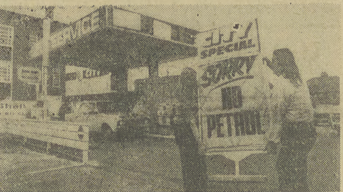
W związku z kryzysem paliwowym w zachodniej Europie, na stacjach benzynowych w Wielkiej Brytanii coraz częściej spotyka się napisy informujące o braku paliwa.

Wśród głównym tematem rozmów były stosunki bilateralne oraz sprawy ich dalszego - wszechstronnego rozwoju. Polsko-rumuńskie rozmowy kontynuowane będą w czwartek i, jak można przewidywać ich głównym tematem będą aktualne zagadnienia międzynarodowe, interesujące oba kraje.