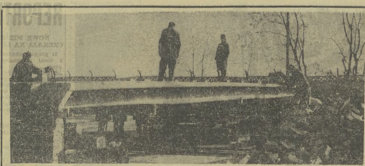
Zespół konstruktorów z Biura Studiów Projektów Typowych Budownictwa Przemysłowego w Warszawie — pod kierunkiem dr S. Kusia — zaprojektował nowy rodzaj płyt strunobetonowych przeznaczonych na stropy wielkich hal przemysłowych. Płyty mają długość 18 m, szerokość — 2 m, natomiast grubość wynosi załedwie... 2 cm. Łączna waga płyty — 5 ton. Prototypy płyt wykonane zostały przez Włocławskie Zakłady Betonarskie i Żelbetowe. Wszystkie próby wypadły pomyślnie.

Problem młodzieży artystycznej w świetle koncepcji społecznej i konkretnie — w aspekcie zatrudnienia — jest problemem bardzo trudnym. O to np. problem plastyków. Jak wiadomo mamy w Krakowie ponad tysiąc artystów plastyków. Liczba ta będzie powiększać się z roku na rok o absolwentów ASP. Niezależnie od plastyków zrzeszonych w ZPAP istnieje grupa działająca poza związkami. Są to absolwenci średnich szkół plastycznych. Tylko w 1964 r. licea opuściło 79 plastyków; 24 w Krakowie, 18 w Tarnowie, 26 w Wiśniczu i 11 w Zakopanem. Kilkunastu dostało się do ASP, paru poszło do UJ na Wydział Historii Sztuki, dwóch innych wyjechało na studia do Turunii. A reszta? Reszta nie to bywa. Jedni dostają się do warsztatów Cepellii, drudzy pracują chałupniczo. Istnieje też różne inne możliwości zarówno w za-