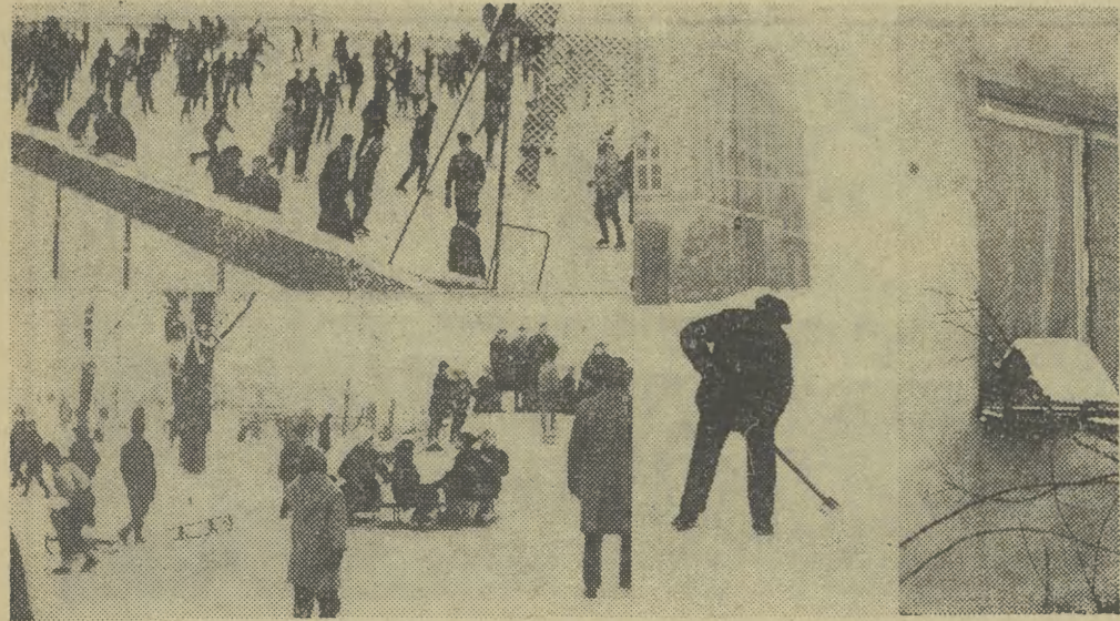
Minione święta przyniosły naszemu miastu zimową oprawę. Skorzystali na tym przede wszystkim dziećmi. Znacznie mniej natomiast zadowolony są dozorczy i pracownicy MPO. Na zdjęciach: zmielone migawki.