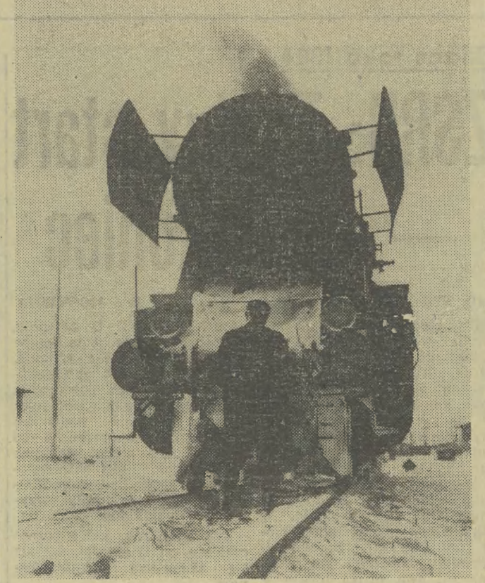
Jak zawsze zima, mroź i opady śnieżne stanowią okres trudnej próby dla pracowników kolej.

Równoległe z zimowiskami trwa akcja harcerskich zimowych wakacji, prowadzona pod hasłem: „Kaźda drużyna i szczerze organizują wakacje sobie i rówieśnikom”. W jej programie szczególny nacisk położono na sporty zimowe, a więc na urządzanie torów saneczkowych, lodowisk, kuligów itp. Niezależnie od tego wszystkie ośrodki harcerskie jak „harcówki”, świetlice w szkołach mają się stać ośrodkami działalności kulturalno-oświatowej, w której programie przewidziano imprezy noworoczne, zjazdów-zjazdów itp. Warto wspomnieć, że tego rodzaju imprezy stanowią równocześnie wstęp do harcerskich obchodów XX rocznicy wyzwolenia Krakowa i ziemi krakowskiej przez Armię Radziecką. Na podkreślenie zasługuje inicjatywa uczestników zimowisk zlokalizowanych w Zakopanem. Wspólnymi siłami obowozów i miejscowych harcerzy zostanie zorganizowana atrakcyjna impreza noworoczna oraz manewry techniczne, połączone ze zdobywaniem Młodzieżowej Odznaki Sprawności Obronnej (MOSO).