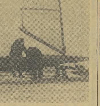
Bojery stają się coraz popularniejszym sportem. Tegoroczna zima przyszła dość wcześnie, więc i sezon w tym sporcie rozpocznie się niebawem. Na zdjęciu: przygotowanie bojerów.