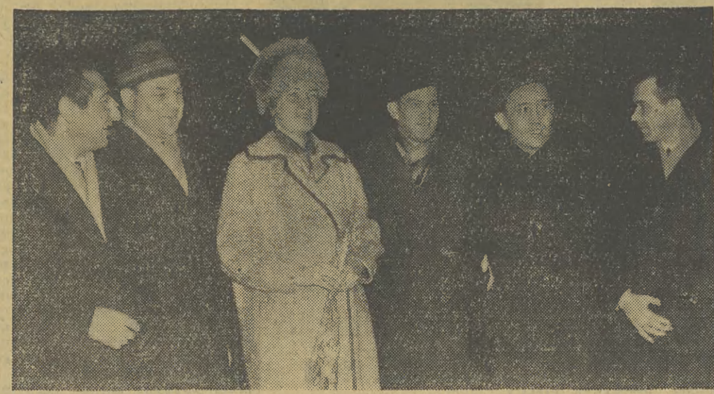
Po 20 latach znów na Ziemi Krakowskiej