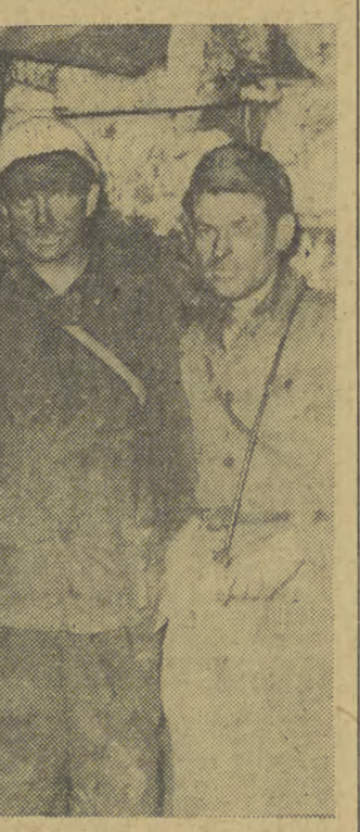
Wicepremier Stefan Ignar z delegacją w Krakowie.

„Działalność tych sił przyjmuje rozmaite formy. Mury i płoty pokryte są afiszami oraz napisami ręcznymi o treści agresywnej antyrządowej, a zwłaszcza wymierzonych przeciwko wojskom państw Układu Warszawskiego, stacjonującym w Czechosłowacji. Podtrzymywane są hasła domagające się neutralności Czechosłowacji. Dołączony do tego należy liczne audycje radiowe różnych, nielegalnych radiostacji, emitujących nierzadko i na różnych falach krótkie audycje o treści wojennej socjalizmowi. Audycje te są nagrywane przez Wolną Europę i inne radiostacje NRP, a następnie odtwarzane jako audycje „wolnego radia czechosłowackiego”. Funkcjonują również konspiracyjne drukarnie. Ukazują się trudno określane przez kogoś wydawnictwa takie czasopisma, jak „Literarni Listy”, „Reporter”, „Prace” itp. W pismach tych pełno jest antysocjalistycznych i antyrządowych wypowiedzi.