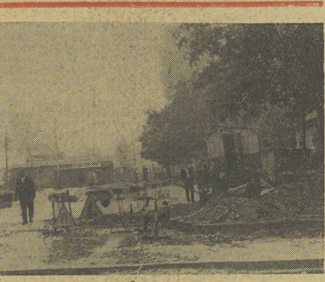
Trwają prace przy przebudowie jednego z najruchliwszych skrzyżowań w naszym mieście — pod Małeczynem.

W nowych obiektach znajdują się magazyny zdolne pomieścić obryznie masy towaru. I tak np. w pomieszczeniach, gdzie utrzymywane są będzie temperatura znacznie poniżej zera — będzie można zamagazynować 6,5-7 tys. ton masy towarowej. Dwa tysiące ton towarów znajduje się w pomieszczeniach chłodniczych. W nowych obiektach produkcyjnych mrożonych owoców i warzyw osiągnie ok. 1,5 tys. ton. Samych truskawek mrozić się tutaj będzie 800-1000 ton, co oznacza podwojenie obecnych możliwości produkcyjnych mrożonek. (B. C.)