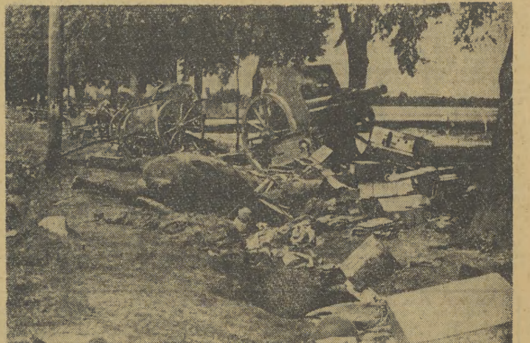
Zdjęcie archiwalne: z września 1939 r., rozbite jaszce i działa polskie.

W Beskidzie Żywieckim na Hali Miziowej w okresie 1970—1972 powstanie nowe schronisko, wyciąg turystyczny, a na dole w Korboliowie buduje się obiekty gastronomiczne.