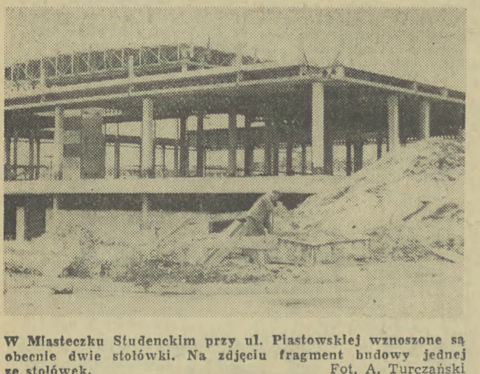
W Miasteczku Studenckim przy ul. Piastowskiej wznoszone są obecnie dwie stołówki...