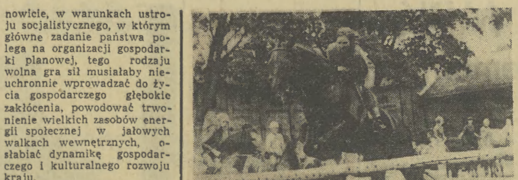
W Państwowym Stadzie Ogierów w Ketrzynie zorganizowano dla studentów z różnych uczelni kraju 3-tygodniowe „wakacje w siódle”. Prace nauki jazdy konnej studenci wykonują wszystkie prace stajenne przy swoich wierzchowcach.