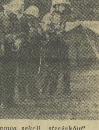
Piaszki-Drużków. Zbiórka alarmowa sekcji „strażaków”

„Jestemy grupą z Lic. Medycznego Pielęgniarstwa w Jaworznie — piszą uczestniczki OHP przebywające w EGR Chelm Górny w woj. Szczecin. Bierzymy udział w akcji żniwnej, a wolny czas poświęcamy na poznanie ziemi szczecińskiej. Jesteśmy dumni z naszej stawy i z tego, że udało nam się poznać smak pracy fizycznej”.