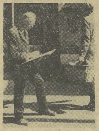
Tego rysownika zainteresował jeden z szczegółów architektury naszego miasta.