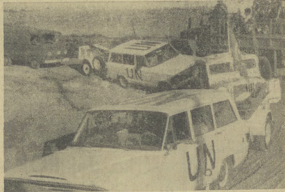
Kolejne grupy obserwatorów ONZ przybywają na linię przerwania ognia na froncie egipsko-izraelskim. Na zdjęciu: kolumna samochodów ONZ w pobliżu Jezior Gorzkich (informacja o sytuacji na Bliskim Wschodzie — str. 2).