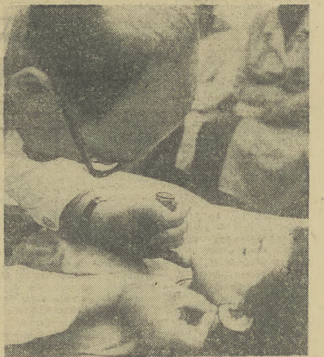
Stara, chińska metoda leczenia przy pomocy akupunktury coraz częściej jest stosowana we współczesnej medycynie. Ostatnio lekarze szpitala w Ružomberku, w Słowacji użyli akupunktury do leczenia głuchoniemego chłopca.

W 1972 r. przyszło na świat w Nowym Jorku ponad 800 dzieci, których matki są narkomankami. Okazało się, że dzieci te przywzrosły się do narkotyku już w łonie matki i że organizm ich domagał się dalszych porcji. Oczywiście nikt nie odważył się podawać narkotyki niemowlętom. Ponad 50 procent dzieci matek-narkomanki umiera wkrótce po przyjęciu na świat.