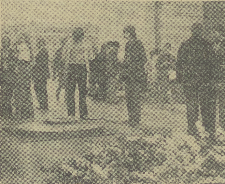
U Grobu Nieznanego Żołnierza pod Łukiem Triumfalnym.

tości, znanych z historii Francji i powszechnej, z dziejów kultury i sztuki. Napoleoński marszałkowie — Ney, Masséna i Murat, a także Molier i Beaumarchais, twórca „Warszawiaków” — Cacamir Delavigne, Rossini, Proust, Oscar Wilde, G. Apollinaire, Sarah Bernhardt, Delacroix, Ingres — długo by wyliczać. Polskich nazwisk — ponad 60. Wśród nich pani Hańskiej, która jak na największą miłość Balzaca przystało — jeśli wierzyć biografom i twórcom telewizyjnego serialu na ten temat — spoczywa we wspólnym grobie z wielkim pisarzem. Z tym, któremu zawdzięcza iż nazwisko jej nie poszło w zapomnienie. A na popiersiu, jaki zdobi nagrobek — Balzac z charakterystyczną dlań grzywą bujnych włosów, „smiastym wąsem” i „prostakimi tysiami twarzy”.