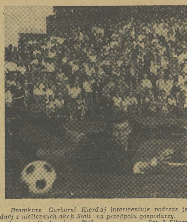
Bramkarz Garbarni Kierdaj interweniuje podczas jednej z niecierpliwych akcji Stali na przedpolu gospodarzy. Z meczu Garbarnia - Stal.