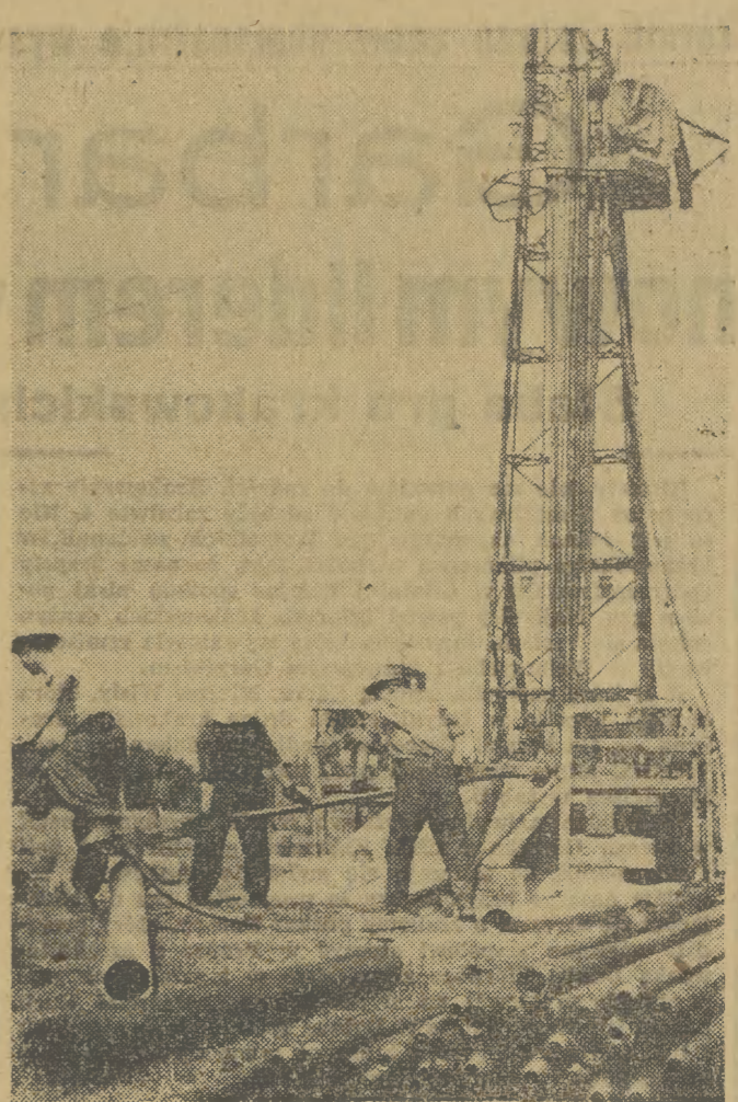
Przez wiele lat twierdzono, że Polska jest uboga przez naturę wyposażona w bogactwa naturalne. W ciągu jednak ostatnich 20-lecia odkryte zostały pokłady węgla, siarki, miedzi, gazu ziemnego, rudy cynku i ołowiu. Sprawa dotarcia do wielkiej ropy jest tylko kwestią dalszych badań i nakładów inwestycyjnych. Na zdjęciu: wiercenia w rejonie Siewierz — Poręba.