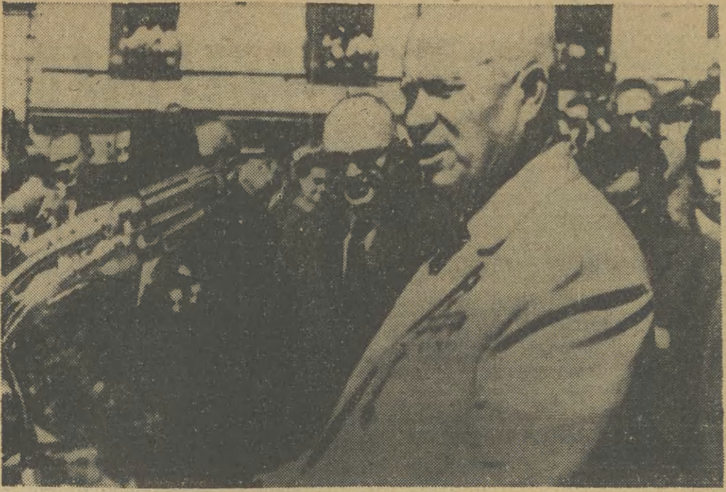
Radziecka delegacja partyjno-rządowa ponownie w Pradze