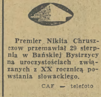
Premier Nikita Chruszczow przemawiał 29 sierpnia w Bańskiej Bystrzycy na uroczystościach związanych z XX rocznicą powstania słowackiego.

W sobotę pierwsze dwa powiaty w woj. szczecińskim — Stargard i Goleniów zameldowały o wykonaniu rocznego planu obowiązkowych dostaw zboża.