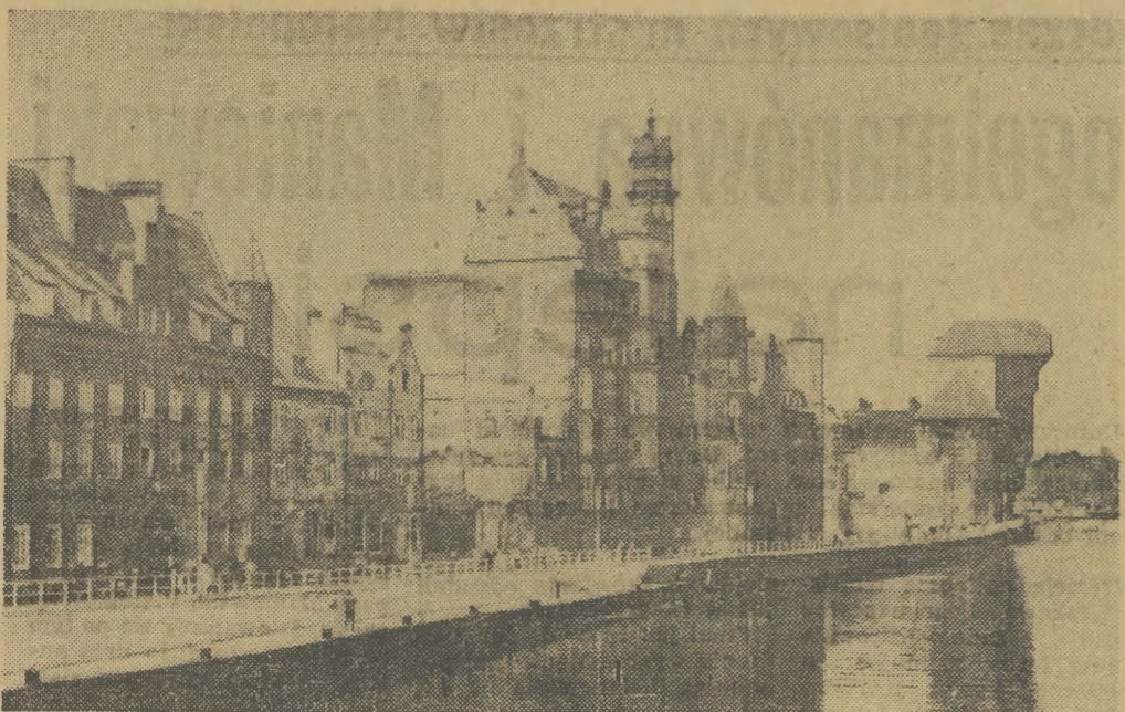
Gdańsk — zabytkowe kamienice nad Motławą z odbudowanym Starzym Żurawiem (1444) obecnie siedziba Muzeum Morskiego.