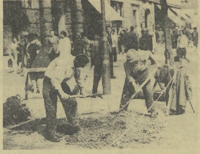
Znow wycięto drzewo w Rynku.

Zbiórka na Rynku Gł. o godzinie 14 w rejonie stłtu przysięgi Kościuszk. Inwalidzi wojenni i ochotnicy żołnierze będą tworzyć osobną grupę.