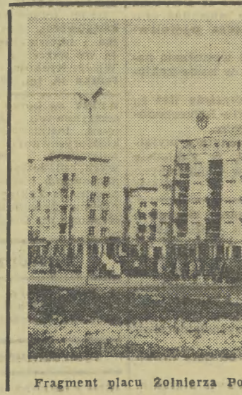
Fragment placu 20-litiera Polskiego w Szczecinie.