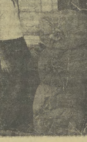
W Gminnej Spółdzielni Marcinkowo w pow. Mragowo przystąpiono już do wymiany zboża siewnego.

„Zagadnienia i Materiały” zawierają również kolejne materiały z IV Zjazdu, dotyczące spraw rolnictwa. (rs)