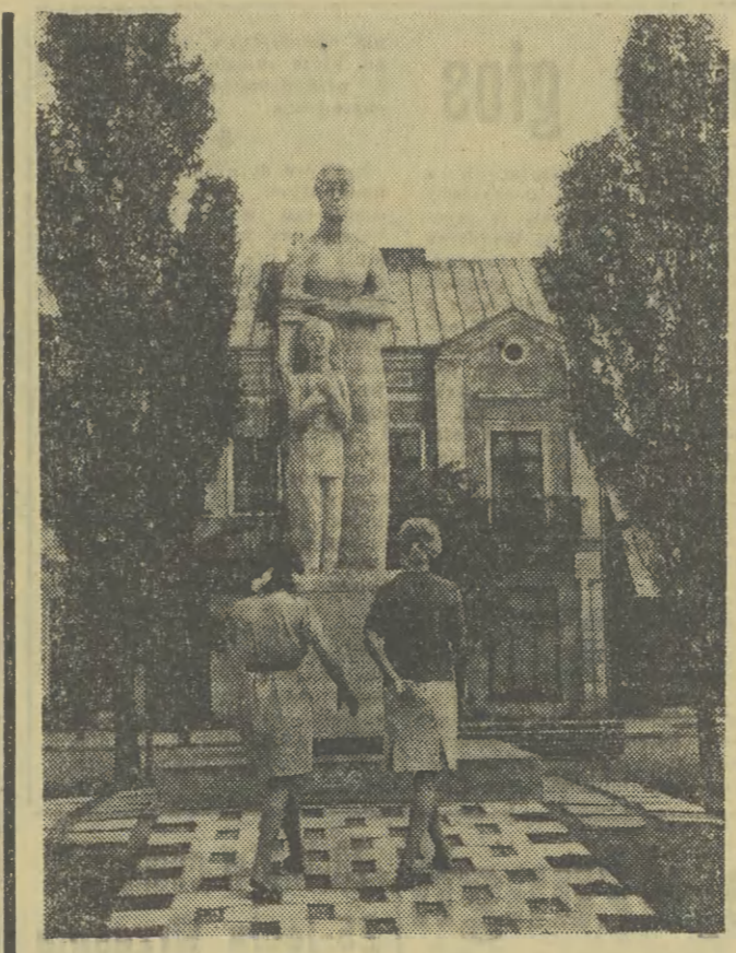
Suwalki — pomnik Marii Konopnickiej