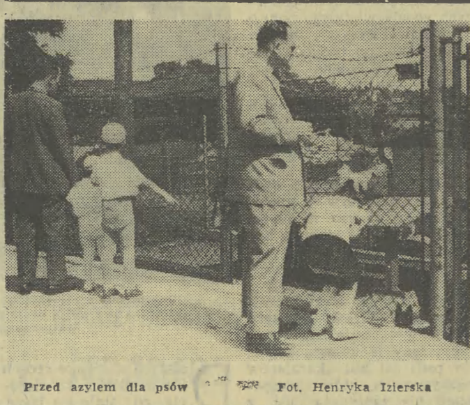
Przed aylem dla psów