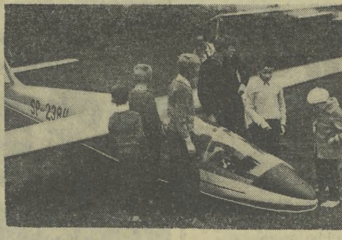
Zainteresowanie młodzieży na Wystawie Lotniczej w Czyżynach

17:15: Radio-rekl., 17:20: „Na wirażu”, 17:50: „Świat w zwierciadle nauki”, 18:00: Konc. dnia, 18:50: Radio-rekl., 19:00: Pol. mel. lud., 19:15: „Ze wsi i o wsi”, 19:30: „Rozmowy o wychowaniu”, 19:40: Konc. Choru, 20:00: Dzień wiecz., 20:20: Wiad. sport., 20:30: Progr. muz., 20:35: Przegł. film., 21:05: Konc. chopin., 21:35: Polifonia franc. XIX w., 21:50: Odpowiedzi z różnych szaf, 22:05: „Bossa Nova Combo”, 22:20: „Ruch”, 22:28: Mel. tan., 22:55: Rad. Poradnik Rodz., 23:00: Ost. wiad., 23:10: Hymn.