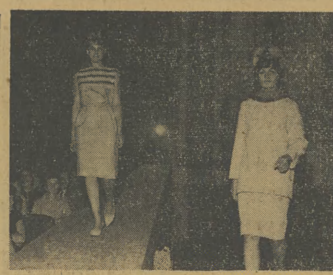
Pokaz mody radzieckiej; Sukienka młodzieżowa i kostiumik Jesienią z futrzaną czapką.

Na budowie stalowni konwertorowej w Hucie im. Lenina po raz pierwszy na terenie kombinatu zastosowano mechaniczne podbijanie torów. Przepięszyć to znacznie budowę skomplikowanej sieci torów łączących poszczególne wydziały nowej stalowni. Pracownicy przedsiębiorstwa Budowy Pieców Przemysłowych pod kierunkiem inż. Bochenka przekonali ekspertów radzieckich i biura projektowe o zaletach spawania konwertorów w hali i transportowania ich na miejsce w postaci. Każdy konwertor składa się z 7 części, które początkowo zamierzano spawać na miejscu w stalowni. Spawanie zwane „blokowym” pozwoli skrócić czas łączenia poszczególnych części konwertora o miesiąc (pierwszą gotową będzie w październiku). Zapewni też lepsze warunki pracy spawaczom, którzy będą mieli łatwiejszy dostęp do korpusu. Zastosowano w stalowni nowy system obudowy transporterów. W trosce o przyszłych pracowników zaprojektowano specjalne przejścia kryte, kładące się z 7 części, które początkowo zamierzano spawać na miejscu w stalowni. Spawanie zwane „blokowym” pozwoli skrócić czas łączenia poszczególnych części konwertora o miesiąc (pierwszą gotową będzie w październiku). Zapewni też lepsze warunki pracy spawaczom, którzy będą mieli łatwiejszy dostęp do korpusu.