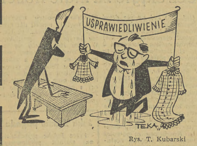
Rys. T. Kubarski

Witalny kiedys na tym miejscu o tym, że do brzoj sprawie pracujące krakowianki nie mają się w co ubrać. Podkreślam — pracujące, bo te właśnie są na ogół klientkami sklepów z gotową odzieżą a nie krakowianki jako „instytucji” drogiej i czasochłonnej.