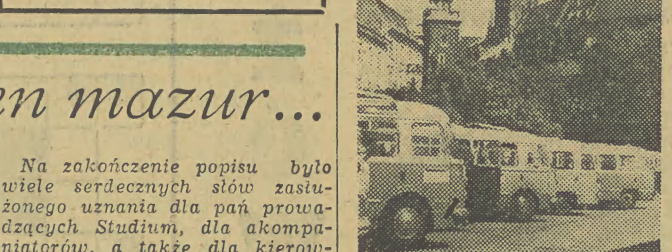
Sezon turystyczny w pełni. Codziennie na parkingu strzeżonym pod Wawelem zajądają dziesiątki autokarów.

Wojewódzki Ośrodek Propagandy Partijnej zawiadomia, że dzisiaj o godzinie 10 w sali konferencyjnej KW PZPR, ul. Solskiego 43 odbędzie się odczyt min. A. Kruczkowskiego na temat „Aktualnych problemów sytuacji międzynarodowej”. Na odczyt prosimy lektorów KW, KP, KD PZPR i aktyw partyjny.