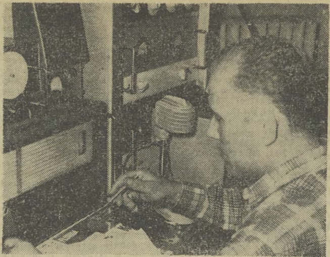
Radiostacja Es Pe Zero uruchomiona z okazji 50 rocznicy Rewolucji Pazdziernikowej uzyskala juz okolo 2 tys. polaczonych z krótkofalowcami calego swiata. Wynikiem tego bedzie niewiaptliwe popularyzowanie Huty im. Lenina do słownie w kazdym zakatku kuli ziemskiej.

Nasz dom posiada wyblne szczescie do genialnych elektrowni. Ognedaj, po dlugich badaniach, nasz elektrownik odkryl w DS-ie elektrownice. Prague on opalentozac swj wy-