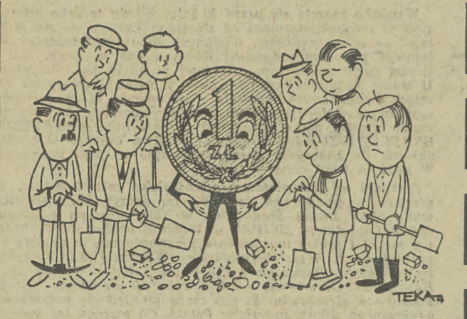
Rys. T. Kubarski

- wszystkim narzekajacym na brak sklepow na nowych osiedlach, aby ich zyczenia zbiegly sie z realizacja zamierzonych - oddania do uzytku w roku 1968;