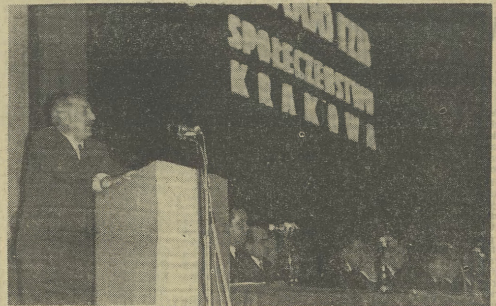
Na zdjęciu u góry: prezydium uroczystej konferencji Samorządu Robotniczego PBM w Nowej Hucie. Przemawia I sekretarz KW PZPR w Krakowie tow. Czesław Domagała. Na zdjęciu dolnym: 100-tysięczna izba zbudowana przez Przedsiębiorstwo Budownictwa Miejskiego w Nowej Hucie.

Przedsiębiorstwa budowlane podległe Ministerstwu Budownictwa i Przemysłu Materiałów Budowlanych wykonały przed terminem roczne zadania. Zbudowano 311,3 tys. izb mieszkalnych; do końca roku przewiduje się oddanie dodatkowo 4 tys. izb. Pierwsze w kraju zadania w zakresie budownictwa mieszkaniowego wykonały zjednoczenia: rzeszowski, łódzki, krakowski i gdański. W budownictwie towarzyszącym przekazano do użytku obiekty o powierzchni 285 tys. m kw. O 15 proc. więcej niż w 1966 r. Zbudowano 3,4 tys. pomieszczeń do nauki; dodatkowo budowlani przekazali co najmniej 150 takich pomieszczeń. W tym roku przedsiębiorstwa budowlane przekazały do eksploatacji ok. 400 ważnych obiektów przemysłowych.