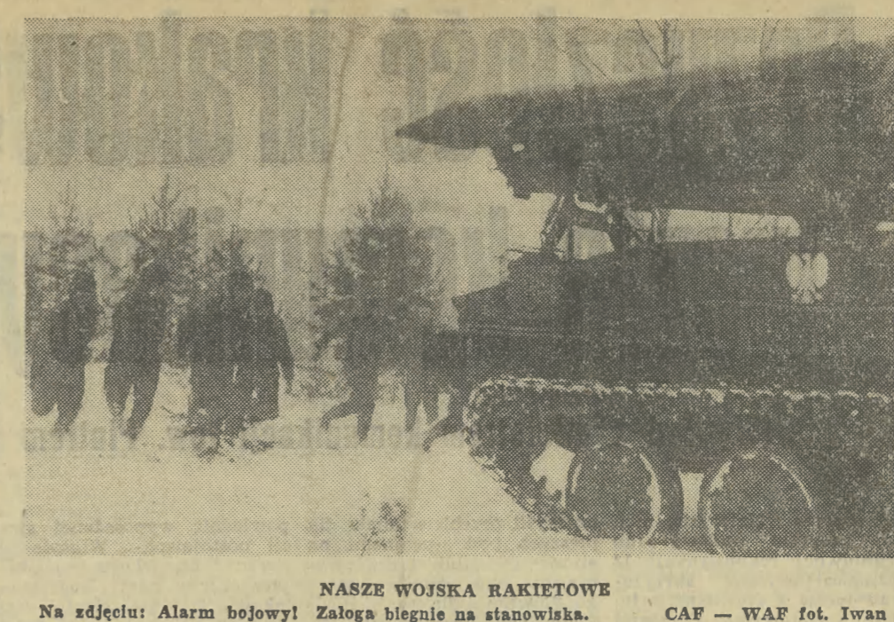
NASZE WOJSKA RAKIETOWE Na zdjęciu: Alarm bojowy! Załoga biegnie na stanowiska.