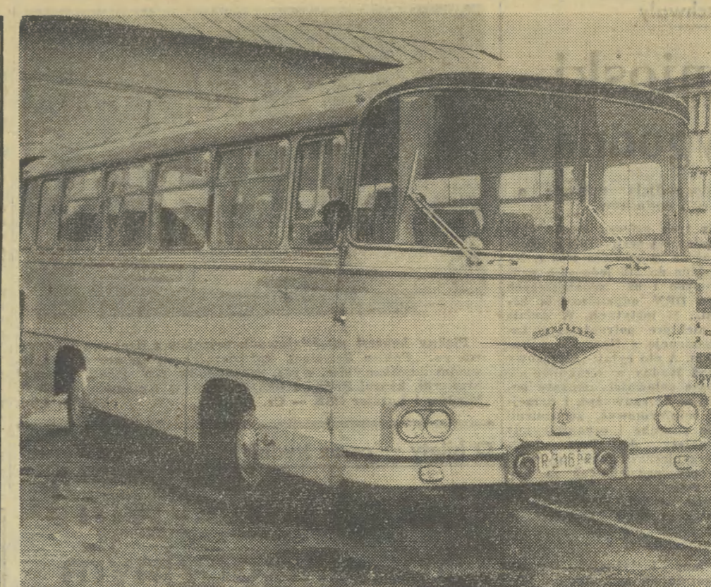
Nowy autobus „Sanos” wyprodukowany przez Sanocką Fabrykę Autobusów w oparciu o dokumentację zakupioną w Jugosławii. Jest to autobus o światowym standardzie użytkowym. W przyszłym roku fabryka wypuści 100 „Sanosów”.