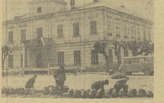
Te zdjęcie robiliśmy w kwietniu. Dziś rynek tarnowski jest już uporządkowany „na wysoki polysk”.