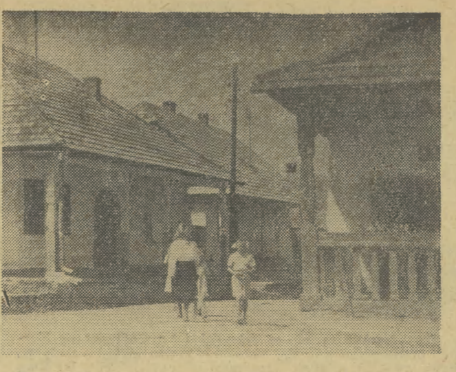
Fragment zabytkowych domów z podcieleniami w Cieżkowicach.

Tu także po porozumieniu się Prezydium MRN z Komitetem Miejskim partii podjęto energiczne kroki. Na plenarnym posiedzeniu Miejskiego Komitetu FJN zapadła uchwała o przystąpieniu do współzawodnictwa z Cieżkowicami. Tuchów w ślad sąsiedza także powołał Komisję i dopisał swój program „na ostatni guzik”. Za pośrednictwem „Gazety” zapoznaliśmy z nim Tuchowskie społeczeństwo i ry-