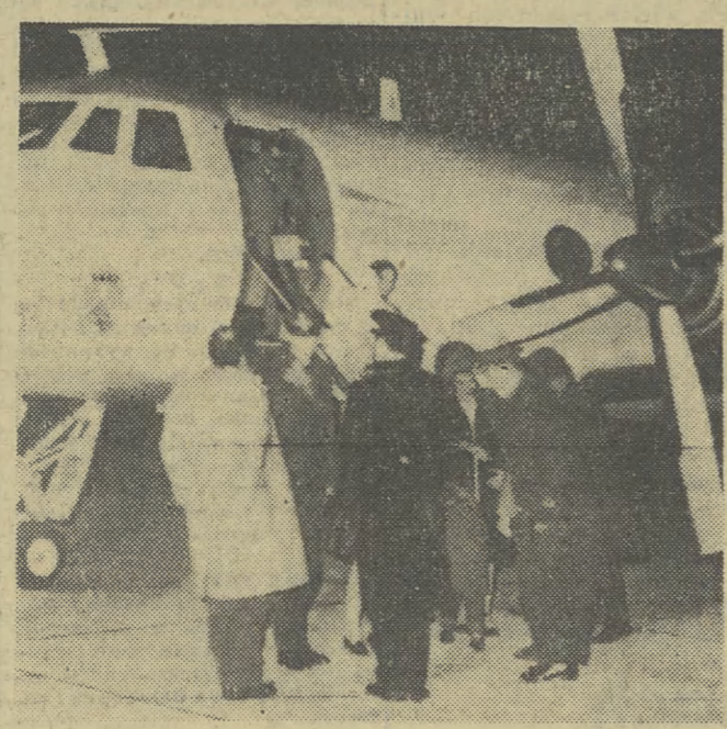
Król Grecji Konstantyn i królowa Maria po przyjeździe na lotnisko w Rzymie, 14 bm.