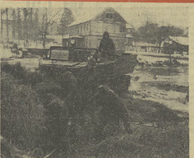
Do katastrofy w pow. Bolesławca. Akcja ratownicza na terenie zalanej przez wodę wsi Tomaszów Bolesławiecki. W akcji tej biorą udział oddziały wojska wyposażone w ciężki sprzęt.

JUTRO: VI Wojewódzka Konferencja Sprawozdawczo- Wyborcza ZMS w Krakowie. DZIŚ O ZMS — czytajcie na str. 3.