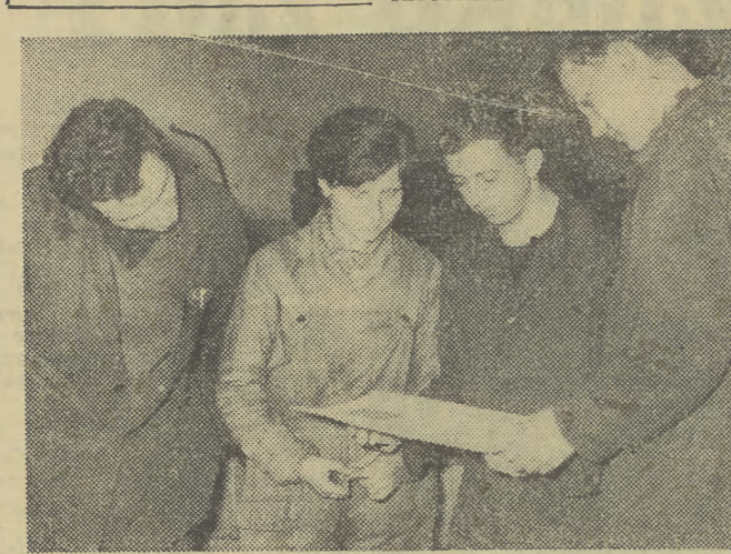
Członkowie kół ZMS z działu Gł. Mechanika chranzowskiego „Fabloku”.

JUTRO 16 GRUDNIA W KRAKOWIE OBRADOWAC BĘDZIE VI WOJEWÓDZKA KONFERENCJA SPRAWOZDAWCZO - WYBORCZA ZMS. NA TĘ OKAZJĘ PRYGOTOWALISMY PUBLIKACJE, Z KTÓRYCH DOWIEDZIE SIĘ O RÓZnorodNEJ DZIAŁALNOŚCI I PROBLEMACH ORGANIZACJI.