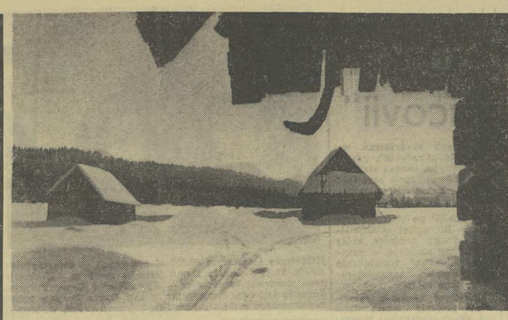
W Zakopanem zima w pełni.