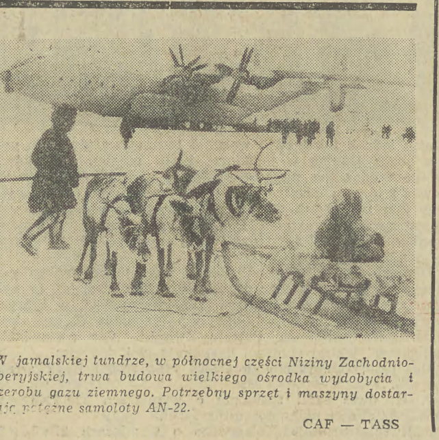
W jamalskiej tundrze, w północnej części Niziny Zachodnio-Niżeryjskiej, trwa budowa wielkiego ośrodka wydobywania i przerobu gazu ziemnego. Potrzebny sprzęt i maszyny dostarczają polskie samoloty AN-22.

Posiadamy również gotowe projekty budowlane wzorcowych posterunków w trzech wariantach zależnych od wielkości załogi i zadań jakie im przeznaczono. Zamierzamy także współuczestniczyć w kosztach inwestycji gminnych w zamian za wydzielenie części pomieszczeń z przeznaczeniem na posterunek. Następnym ważnym zadaniem jest zapewnienie załogom posterunków służbowych mieszkań na wsi, gdyż trudno mówić o właściwym czuwaniu nad bezpieczeństwem i porządkiem w terenie w sytuacji, gdy milicjant mieszka w odległości 40 lub 50 km, a także przyjadłki również się zdarzają.