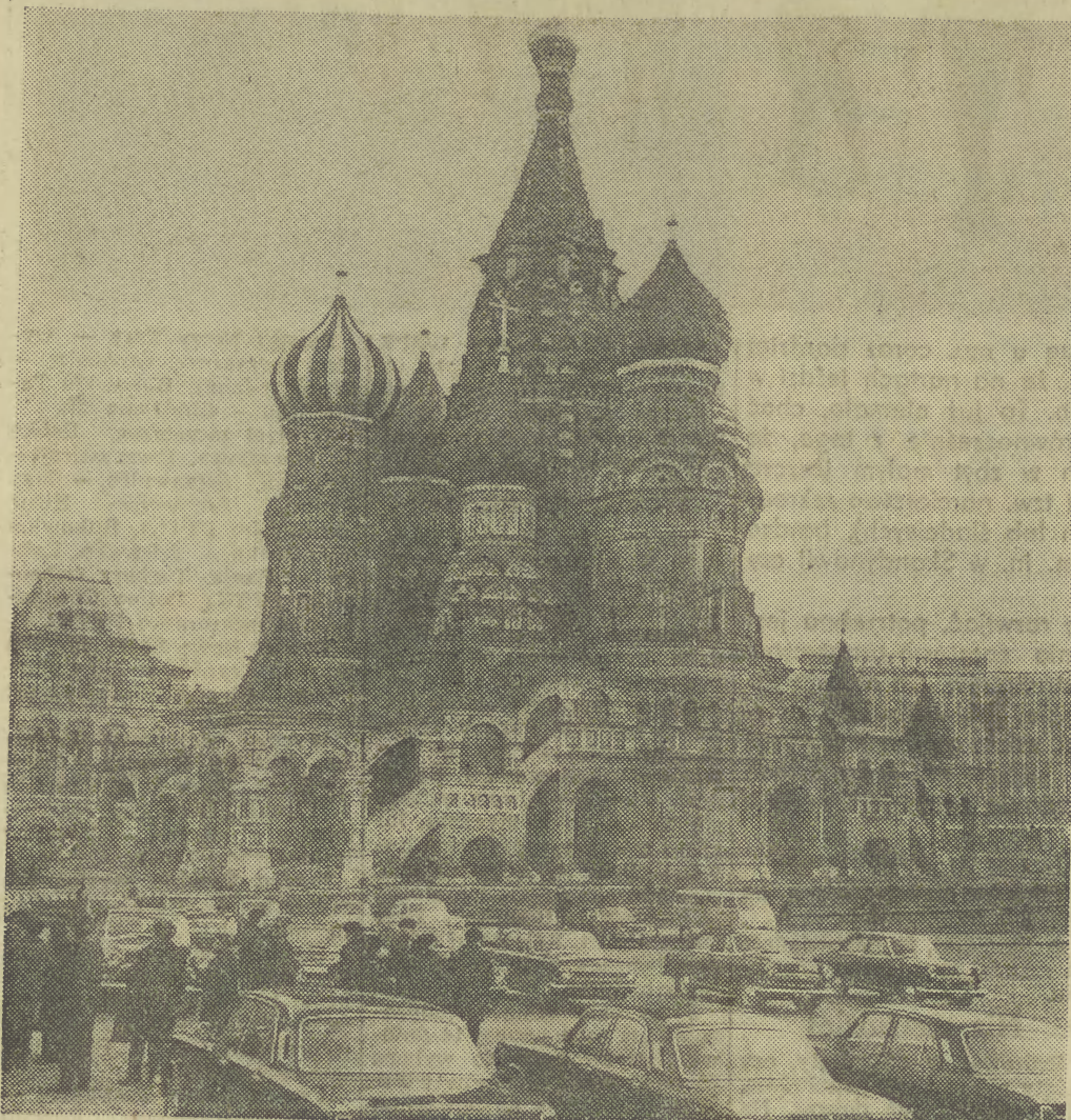
Cerkiew Wasyla Błażennego. Tu spotyka się nowoczesność z przeszłością.