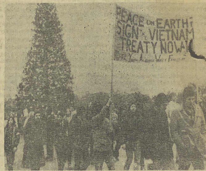
25 bm. w Waszyngtonie odbyła się demonstracja, której uczestnicy domagali się natychmiastowego zaprzestania bombardowań DRW i podpisania porozumienia w sprawie pokoju w Wietnamie.

Dowództwo amerykańskie w Sajgonie oznajmiło we wtorek, że o godz. 13.00 czasu lokalnego po 36-godzinnej przerwie lotnictwo USA wznowiło bombardowania DRW.