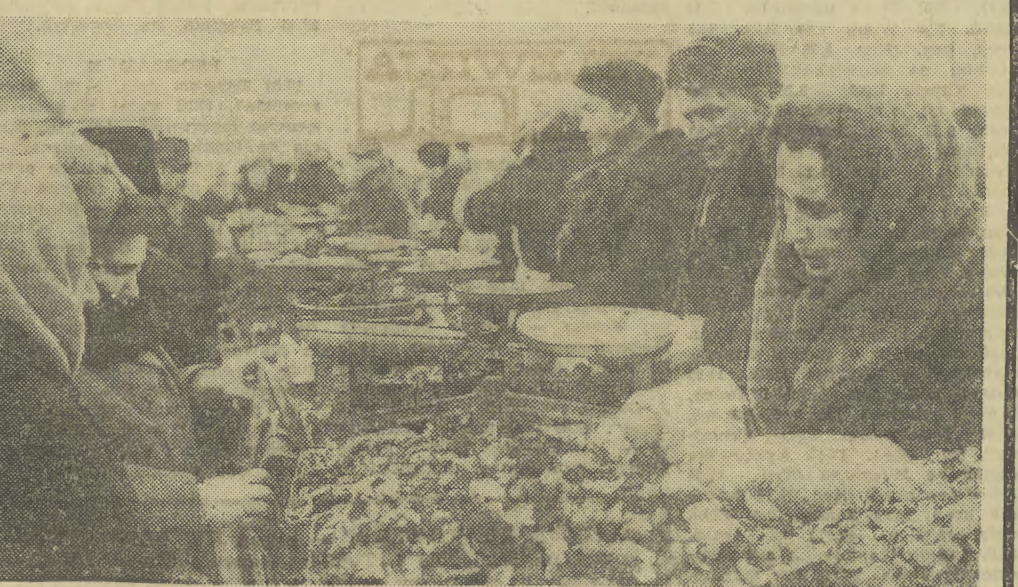
Centralny bazar. Suszone owoce i grzyby.