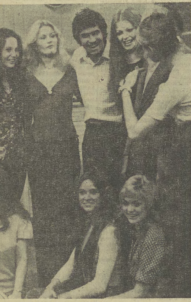
Najlepszy sportowiec świata 1972 roku podczas próby w studio telewizyjnym.

Udział wzięli mogą pracownicy spółdzielni i sympatycy klubu. Zgłoszenia na miejscu, w dniu zawodów (Dekerta 21).