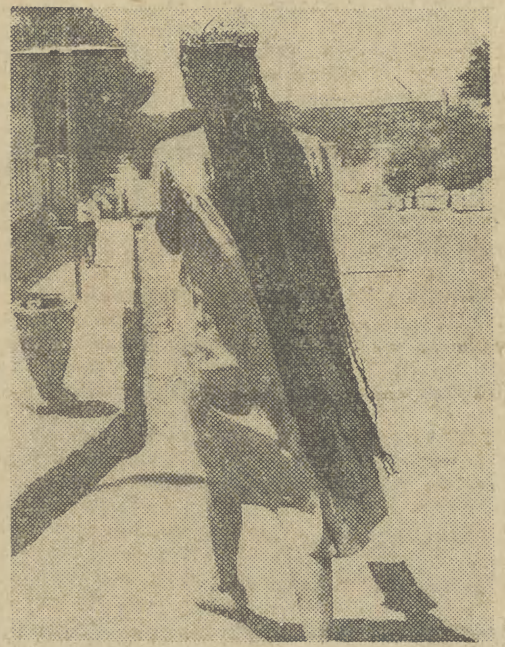
To nie peruczka...

Advokat z urzędu dość oryginalnie broił swego klienta, twierdząc, iż zastępuje on na pobłażliwość sądu, ponieważ dotychczas nie wykazał ułudności do uprawianego procederu.