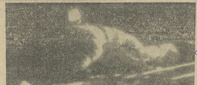
17 bm. amerykański astronauta R. Evans z załogi „Apollo-17” opuścił pokład pojazdu i odbył spacer w kosmosie.