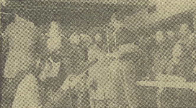
Już 10 dni trwa strajk pracowników Europejskiej Rady Ekonomicznej posiadającej swoje biura w Brukseli, Lutsemburgu i Strasburgu. Pracownicy ci domagają się podwyższenia płac. Na zdjęciu: pracownicy ERE w Brukseli podczas spotkania z przedstawicielami związków zawodowych i prasą.