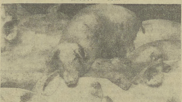
Jakże potulne... A mówią, że ryją...