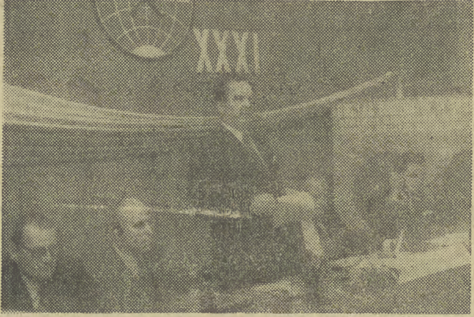
13 bm. obradowało w Warszawie XXXI posiedzenie Międzynarodowego Komitetu Organizacyjnego Światowych Kongresów Górniczych pod protektorem wicepremiera, min. górnictwa i energetyki Jana Miłregi.