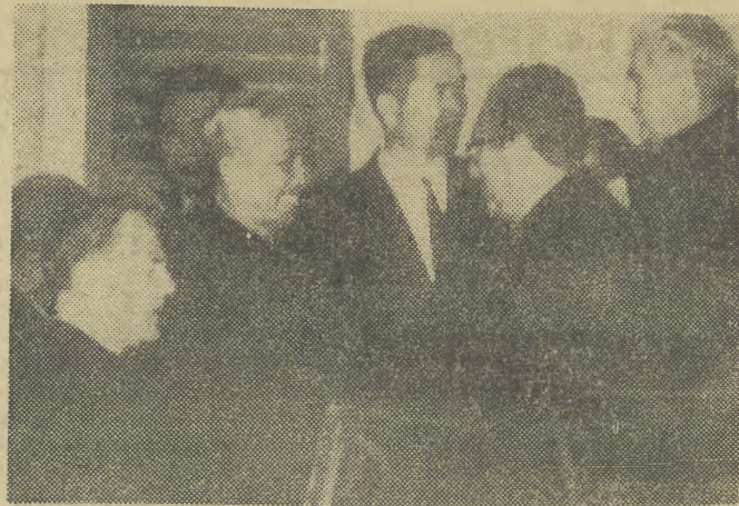
W Gif-sur-Yvette odbyło się kolejne poufne spotkanie specjalnego doradcy delegacji DRW na rozmowy paryskie, Le Duc Tho (drugi z lewej) ze specjalnym doradcą prezydenta Nixona, Henry Kissingerem (drugi z prawej).