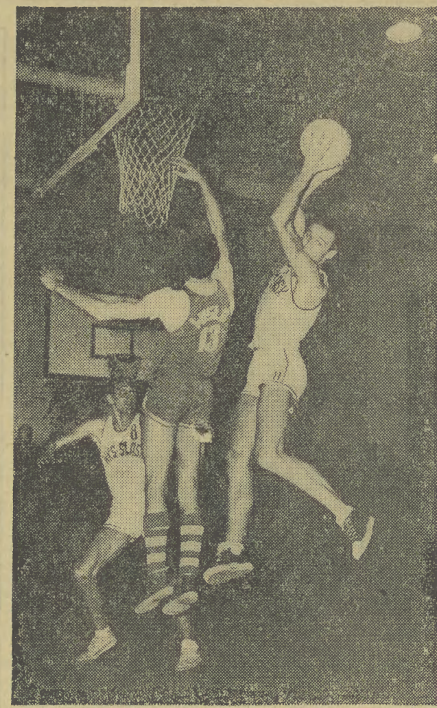
Koszykarki zakończyły pierwszą rundę rozgrywek. Oceniamy ich po pierwszych bojach. Na zdjęciu: pojedynkę krakowskiej Wisły z wrocławskim Śląskiem. Te dwie człowe drużyny kandydują do tytułu mistrza Polski.