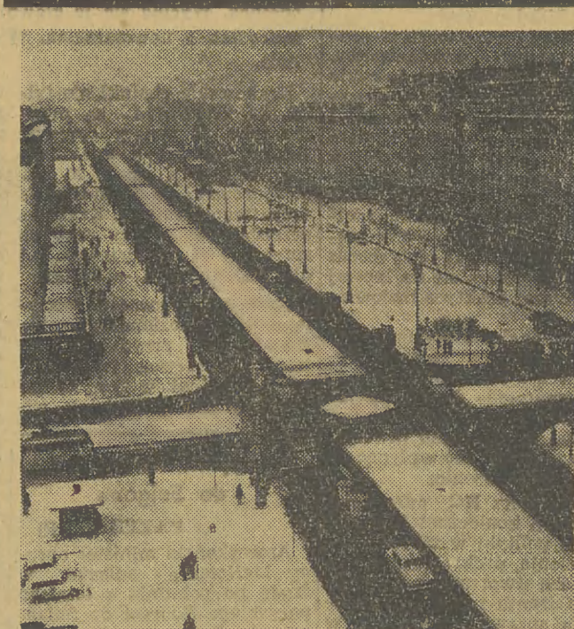
W Saint Jean de Maurienne, w Alpach, samochód wiozący 3 młode kobiety i ich towarzyszy wycieczki z autostrady, z poniedziałku na wtorek. Dwu z pasażerów, nauczycieli jazdy na nartach, poniosło śmierć na miejscu, natomiast 4 innych leżało całą noc w rowie przy temperaturze powietrza minus 10 stopni Celsjusza i dzięki temu, jak stwierdził potem badający ich lekarz, 3 z nich zawiądzają życie. W niskiej temperaturze bowiem, ich organizmy mogły wytrzymać ciężkie obrażenia.

W adenijskim „Dzienniku Ustaw” ukazał się dekret wprowadzający stan wyjątkowy na terytorium tzw. Federacji Południowo-Arabskiej. Policja i wojsko mają prawo na mocy dekretu przeprowadzać rewizje, zatrzymywać i aresztować bez zezwolenia władz sądowych każdą „podejrzana osobę” i „niepożądanych cudzoziemców”.