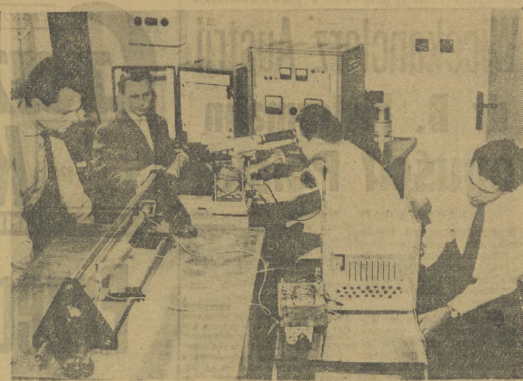
Pracownicy nauki Instytutu Techniki Czechosłowackiej Akademii Nauk w Brnie skonstruowali generator molekularny — nowe urządzenie, mogące znaleźć szerokie zastosowanie w spektroskopii, telekomunikacji itp. Aparat wytwarza z rury kwarowej, zawierającej mieszaninę gazów helu i neonu promieniowanie ciągłe o długości fali 1,15 mikrona. Na zdjęciu: Strojenie i próby generatora w laboratorium Instytutu Techniki.

Napięta sytuacja w Adenie KAIR (PAP). Jak informuje AFE, sytuacja w Adenie staje się coraz bardziej napięta na skutek fałd arestowań rozpętanych przez kolonialne władze brytyjskie w odpowiedzi na zamach przeciw wysiokiemu komisarzowi brytyjskiemu w Adenie, Treviskowi. W całym Adenie ogłoszono stan wyjątkowy. Polcja przeprowadziła masowe aresztowania, których ofiarą padli przede wszystkim działacze związkowi i członkowie ludowej partii socjalistycznej wraz z jej sekretarzem generalnym. Poza tym kilkuset Jemeńczyków zostało wydalonych z Adenu.