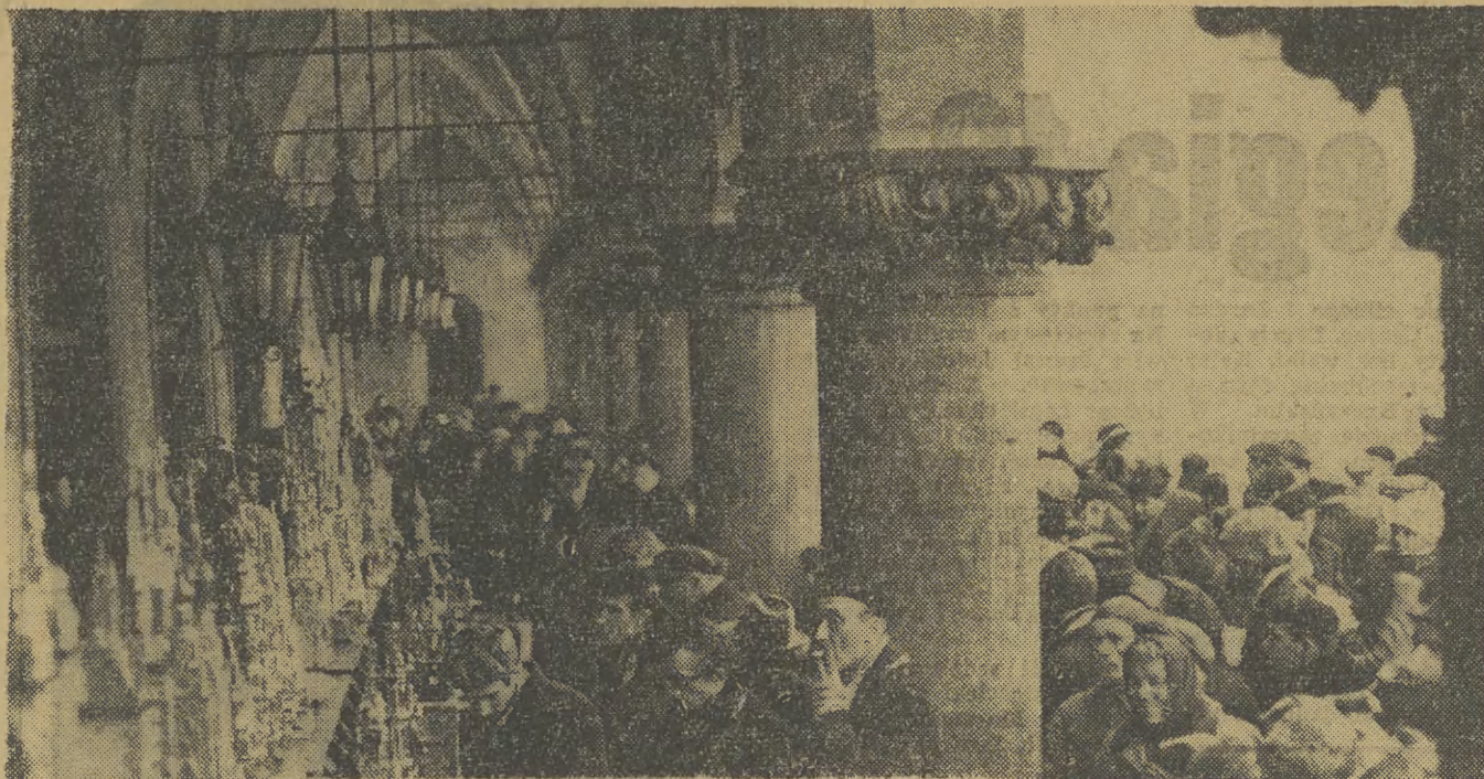
Swe prace szopkarze stawili w amfiladzie pod arkadami Sukienic.