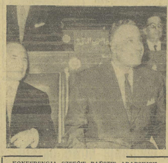
KONFERENCJA SZEFÓW PAŃSTW ARABSKICH. Na zdjęciu: prezydent Naser i minister spraw zagranicznych ZRA Mahmud Fawzi podczas inauguracyjnej sesji obrad konferencji szefów państw arabskich w Chartumie.

W kolach dziennikarskich i w kuluarach konferencji państw arabskich, że niezależnie od brzmienia porządku dziennego na czole wysuwa się podstawowy problem krytyczny — drogowym nasze-rogowców. Wśród dotkliwych chartumskich skwaru czekamy na wieści spoza zamkniętych drzwi.