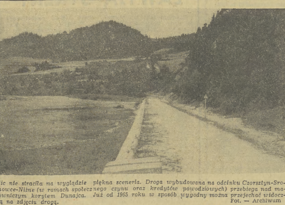
Nie stracifa na wyglądzie piękna sceneria. Droga wybudowana na odcinku Czorstyn-Sromowce-Niżne (w ramach społecznego czynu oraz kredytów powoźdowych) przebiega nad malowniczym korytem Dunajca. Już od 1965 roku w sposób wygodny można przejechać widoczną na zdjęciu drogą.

Proces trwać będzie przysiężalnie do początku 1968 roku. Zeznawać ma 67 świadków.