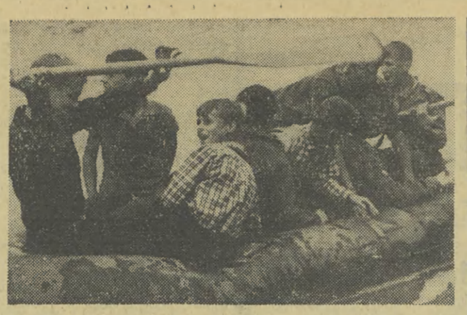
Dużym zainteresowaniem uczestników harcerskich Waka-cji Drużyn Miejskich cieszyły się zajęcia na wodzie. Na zdjęciu: podczas zajęć na zalewie w Nowej Hucie.

5.00 Wiadomości, 5.05 Muż. 5.30 Muż. 6.00 Progn. pog. 6.30 Muż. 6.30 Dziennik. 6.40 Skryżka PKK. 6.45 „Propozujemy, informujemy, przypominamy”. 7.00 Progn. pog. 7.01 Aud. aktualna. 7.30 Dziennik. 7.45 Progn. pog. 7.46 Antena 8.35 Polska muz. lud. 9.00 Muż. balet. 9.40 Z życia Zw. Radz. 10.00 Muż. 10.05 Koncert Ork. PR. 10.30 „Cichy Don” — pow. 11.10 „W obłędzie nauki”. 11.20 Poradnia Redzina. 11.25 z muzyki XX wieku. 11.55 Kom. z st. wód. 12.05 Wiktor Ostrowski. 10.20 Koncert muz. operowej. 11.00 Walce i tanga. 11.20 Orkiestra Mandolinistów. 11.49 „Rodzica a dziecko”. 11.55 Kom. o st. wód. 12.05 Wiadomości. 12.10 „Ożenił się Jasieniec”. 12.25 „Rolniczy kwadrans”. 12.40 „Wiecej, lepiej, taniej”. 13.00 G. Wiedzielska Orkiestra. 13.20 Utwory Wolfganga Amadeusza Mozarta. 14.00 „Karty z naszych dziejów” — „O Ludwiku Waryjskim”.