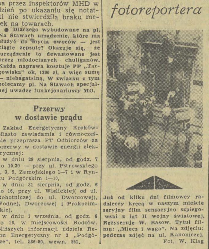
Żuż od kilku dni filmowy radiodrezy kręcił w naszym mieście seryjny film senaryjny szpiecko-świad z lat II wojny światowej. Reżyseruje W. Basow. Tytuł filmu: „Miecz i waga”. Na zdjęciu: podczas zdjęć na ul. Kanoniczej.

14.15 Sportowcy więcej na start. 14.30 Z estrad i scen operowych. 15.00 Wład. 15.05 Młodz. Zespół Instr. „Rocznik 64”. 15.15 Utwory Współł. komp. pol. 15.45 Radioreklama. 16.00 Popołudnie z młodzieżą. 17.55 Wład. 18.00 Koncert sławnych lubiników. 18.43 „Kwadran z dedykacją”. 19.00 „Praktyczna Pani”. 19.05 „Z księgarzkiej lady”. 19.10 Przegład wydarzeń ekon. 19.30 Koncert ork. PR. 20.00 Wład. 20.30 Wiecez literacko-muzyczny. 23.00 Dziennik. 23.10 Wład. sport. 23.15 Sylwetka kompozytora — Witold Maliszewski. 24.00 Wiadomości. 0.05 Kalendarz Radiowy. 0.10-2.00 Program nocny z Rozłośni PR w Katowicach.