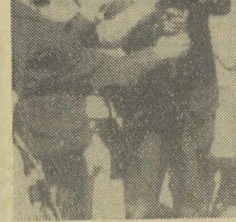
Kilkudziesięciu maratończyków amerykańskich przebiegło pieszko cały obszar USA — od San Francisco do Waszyngtonu, niosąc znicz zapalony w Hiroszimie. Akcja ta, zorganizowana przez amerykańskich bojowników o pokój, rozpoczęła się 27 bm. w San Francisco, dokąd znicz został przewieziony samolotem przez Ocean.

Amerykańscy piraci kontynuowali w niedzielę zbrodnicze bombardowania Demokratycznej Republiki Wietnamu. Złe warunki atmosferyczne spowodowały pewne ograniczenie zasięgu nalotów. Głównymi obiektami rajdów amerykańskich były linie komunikacyjne w rejonie Nam Dinh, 72 km na południowy zachód od Hajfongu, Atakow-