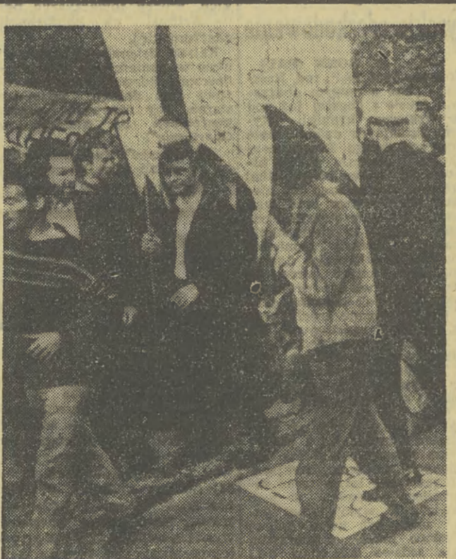
Na zdjęciu: fragment demonstracji.

specjalny wysłannik U Thanta, do spraw uchodźców i jeńców wojennych z czerwcowej wojny na Bliskim Wschodzie.