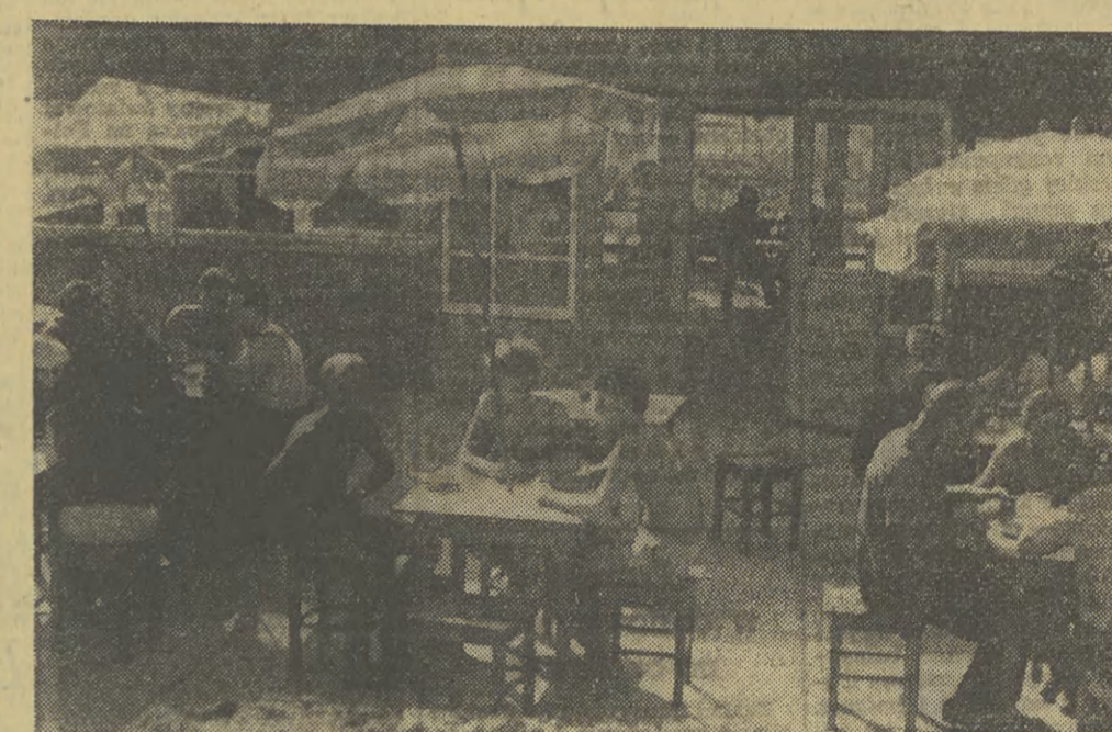
Mimo jeszcze większego niż w ubiegłym roku napływu letników i turystów w rejon Jeziora Rożnowskiego, handel na ogół dobrze w tym sezonie daje sobie radę z ich wyżywieniem. Na zdjęciu: w samoobslugowym pawilonie gastronomicznym w Gródku nad Dunajcem.

PPTK, gdzie mimo braku komfortu zawsze panuje schludność i porządek. Czysta jest zresztą cała Węgierska Górka, a handel znajdujący się w rękach PSS nieźle radzi sobie z zaopatrzeniem i wyżywieniem przyjeżdżnych. Podobnie jest nad jeziorem w Międzybrodziu Bialskim i Porąbce, w której dużym powodzeniem cieszy się gospoda „Turystyczna”, z honorem podtrzymująca dobre tradycje polskiej kuchni. Poświęceniem tego są liczne pochwały wpisane do książki wniosków, a wśród nich grupy przedstawiciele ONZ z Etiopii, ZRA, Iraku, Iranu, Syrii, Maroka i Rumunii. Kończąc się wakacje, kończy się nasz turystyczny trop. Po raz ostatni jego śladem ruszymy w przyszły wtorek 29 bm. A później? Później przedstawić czas na ocenę tegorocznego sezonu. (en)