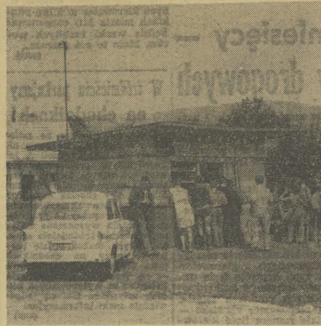
Obrzeża Jeziora Rożnowskiego nadal czekają na kompleksowe zagospodarowanie. Wraździe lodgoyowicka Gminna Spółdzielnia jak i Wojewódzkie Przedsiębiorstwo Gastronomiczno-Turystyczne zbudowały tu kilka obiektów handlowych, ale nie zaspokajają one w sezonie potrzeb. Będzie to możliwe dopiero za kilka lat, kiedy zrealizuje się planowane tu inwestycje. Na zdjęciu: przed kioskem spożywczym w Bierniej.