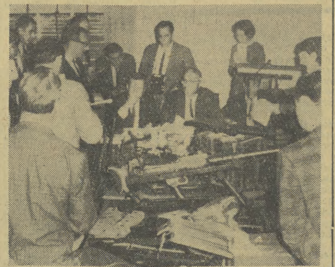
W jednej z dzielnic Nowego Jorku — Bronx, policja wykryła arsenał broni należącej do profaszystowskiej organizacji John Birch Society. Aresztowano 4 członków organizacji prawniczych, spośród których 2 należą do John Birch Society. Na zdjęciu: stopy broni w wykrytym lokalu w Bronx.

WARSZAWA (PAP) Na jesień kilka naszych zespołów teatralnych będzie na zagranicznych scenach. Warszawski Teatr Narodowy udam się do Wenecji na międzynarodowy festiwal, gdzie wystąpi z „Żywotem Józefa” Mikołaja Reja. Inna czołowa scena stolicy — Teatr Współczesny uczestniczyć będzie w festiwalu we Florencji, prezentując tam „Ifigenię w Taurydzie” Goethego. Wrocławski Teatr-Laboratorium weźmie udział w festiwalu teatrów awangardowych w Jufościawli. Zespół Teatr Powszechny wyjedzie prawdopodobnie w październiku do Pragi na zaproszenie Teatru im. S. K. Neumanna, z którym utrzymuje stałą współpracę.