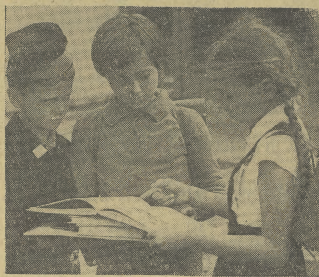
Przed nowym rokiem szkolnym.

Jeśli chodzi o artykuł III (międzynarodowa kontrola nad przestrzeganiem warunków układu) — przedstawiciele delegacji ZSRR i delegacji USA wyrazili nadzieję, że uda się uzgodnić jego treść do czasu rozpoczęcia we wrześniu br. obrad sesji Zgromadzenia Ogólnego Narodów Zjednoczonych w Nowym Jorku.