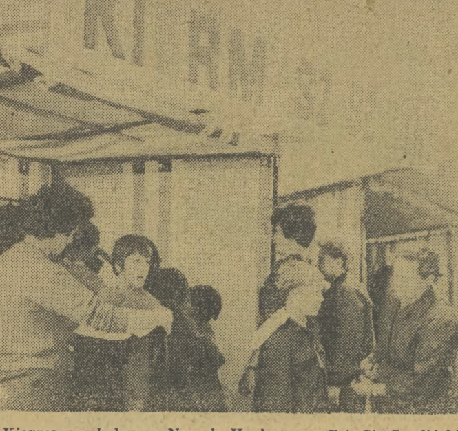
Kiermasz szkolny w Nowej Hucie.