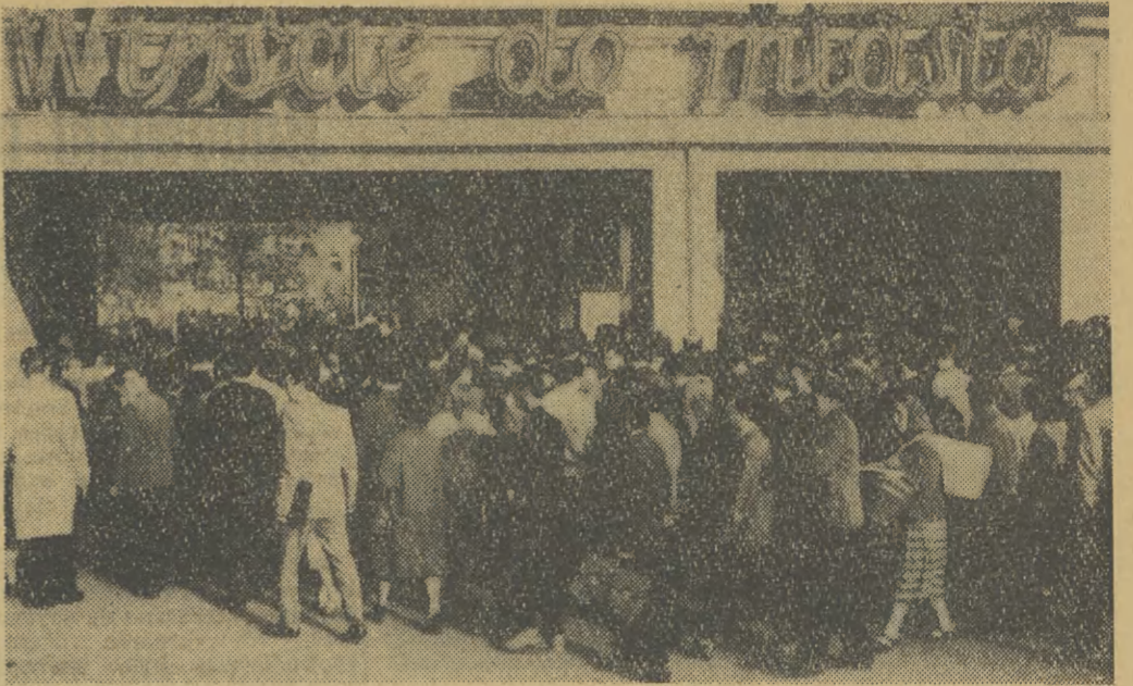
Zżyliśmy się z tym zjawiskiem. Ba! Sami nieraz jesteśmy jego częścią. Stanowi ono nieodłączną — charakterystyczną cechę rozwoju przemysłowego naszego kraju, regionu. Przyobleczone w obraz codziennych dojazdów setek, tysięcy ludzi do pracy czy z pracy, nie robi już wrażenia, jest normalną codziennością.

— Jaki jest stan budownictwa przemysłowego i realizacja inwestycji regionu krakowskiego w świetle dokonanej organizacyjno-produkcyjnych po VII Plenum KC? — Ogólnie rzecz biorąc w budownictwie, tak jak w pozostałych działach gospodarki nastąpiła w I półroczu br. znaczna poprawa w stosunku do analogicznego okresu roku ubiegłego, a zwłaszcza w zakresie wydajności pracy. Tak np. w przedsiębiorstwach podległych Krakowskiemu Zjednoczeniu Budownictwa wydajność produkcji na jednego robotnika wzrosła w I półroczu 1967 r. o 11,8 proc. w stosunku do I półroczu 1966, czyli o 8,9 proc. tyż, a w przedsiębiorstwach podległych Zjednoczeniu Budownictwa Województwa