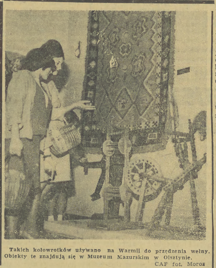
Takich kołowrotek używano na Warmii do przedzenia wełny. Obiekty te znajdują się w Muzeum Mazurskim w Olsztynie.

Hanka drgnęła, ale nie spuściła oczu. Po chwili doktor ciągnął dalej. — W tym okresie zmienili się również upodobania mojej żony. Mecenas Sitko poszedł w odwstawkę, a jego miejsce zajął inżynier Sadowski. Od tej chwili postanowiłem pozbyć się Zofii; okazała nadarzała się niebawem... Była sobota. Wracałem ze szpitala zmęczony i pochłonięty trapiącymi mnie myślami. Za lotniskiem w Gocławku, zauważyłem, że samochód, wbrew mej woli, stałe zjeżdża na prawa stronę. Gdy wysiadłem, stwierdziłem defekt w prawym, przednim kole. Jakoś dojechałem do warsztatu Nowickiego. Mechanik nie zastałem, zaproponowałem więc jego synowi, aby zmienił mi felki; po godzinie wszystko było gotowe. Po powrocie do domu, zagarażowałem wóz, w przejściu pozdrowiłem towarzystwo grające w