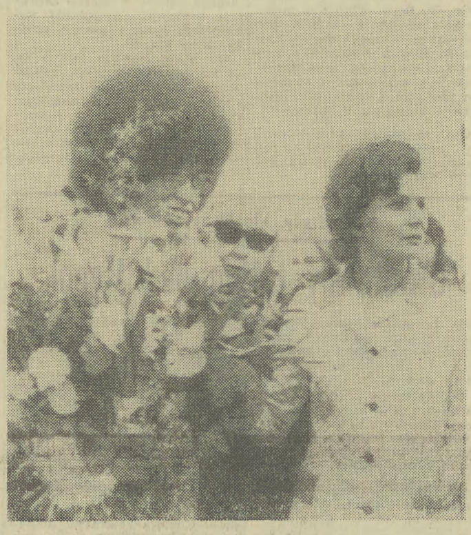
Angela Davis w Moskwie

Dość należy, że wypowiedź Waldheima jest o tyle interesująca, iż nastąpiła w dwa dni po spotkaniu sekretarza generalnego w Monachium z kanclerzem Brandtem, jak i szefem opozycji Barzelem.