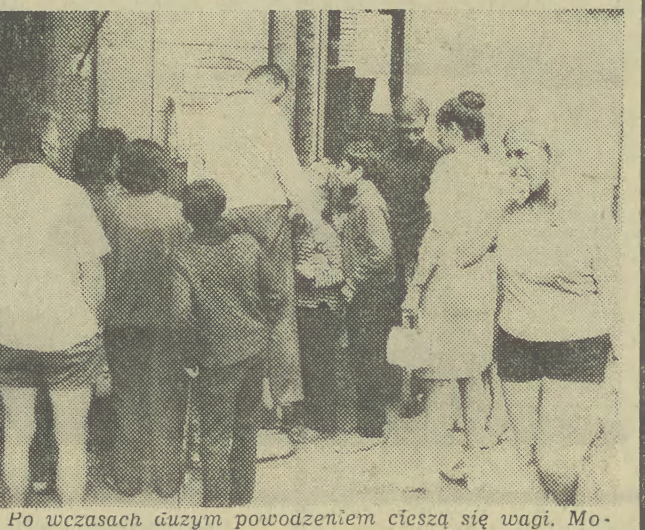
Po uczasach dużym powodem cieszą się wagi. Możemy przytulić!

Idąc ulicami Krakowa niejednokrotnie spotykamy się z brakiem tablic informujących o nazwie ulicy. Sprawy to sporo kłopotów nie tylko przyjeźdźcom, ale również samym mieszkańcom naszego miasta. Według pobieżnej oceny w takim stanie znajduje się około 20 proc. wszystkich ulic. Naszym zdaniem pomoc w rozwiązaniu tego problemu mogłyby harcerze. Dwie, trzy akcje harcerskie bardzo ułatwiłyby pracę odpowiednim przedsiębiorstwom. Chodzi o prostą o wyszukanie w Krakowie ulic nieznanymi i zgłoszenie ich ustnie lub piśmiennie do działu miejskiego naszej redakcji, za co z góry serdecznie dziękujemy. Jest jeszcze jeden drobiazg, który chcemy zasygnalizować. Niektóre nazwy ulic to nazwiska ludzi, o których pamięć chcemy utrwalić w naszym społeczeństwie. To jest dobry pomysł. Wydaje nam się jednak, że można by pod niektórymi umieszczyć krótką informację dotyczącą samej wyróżnionej osoby. (Rch)