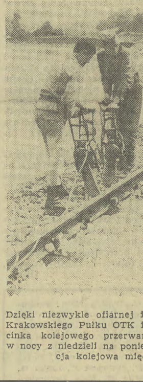
Dzięki niezwykle ofiarnej i wyteżonej pracy kolejarzy i żołnierzy Krakowskiego Pułku OTK Im. B. Głowackiego...

(Inf. wł.). Powódź, która przed tygodniem nawiedziła pewne rejon województwa krakowskiego wyrządziła niemało szkód.