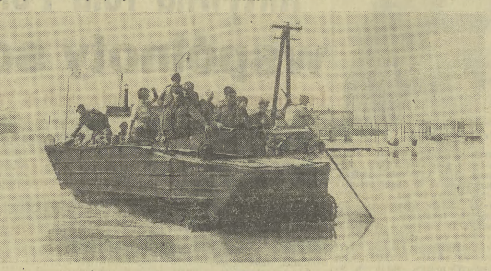
Żołnierze ewakuują dzieci ze szkoły na Skale w Grobli.

Trwa intensywna akcja ratunkowa; udziela się także różnym form pomocy poszkodowanej ludności. Wyplacane są zasiłki pieniężne, dostarcza się bezpłatnie żywność, leki, odzież, działają liczne ekipy lekarskie, przede wszystkim w miejscach ewakuacji. Natychmiast po ustąpieniu wody przystępuje się do odbudowy dróg zarówno państwowych jak i lokalnych, czy ko-