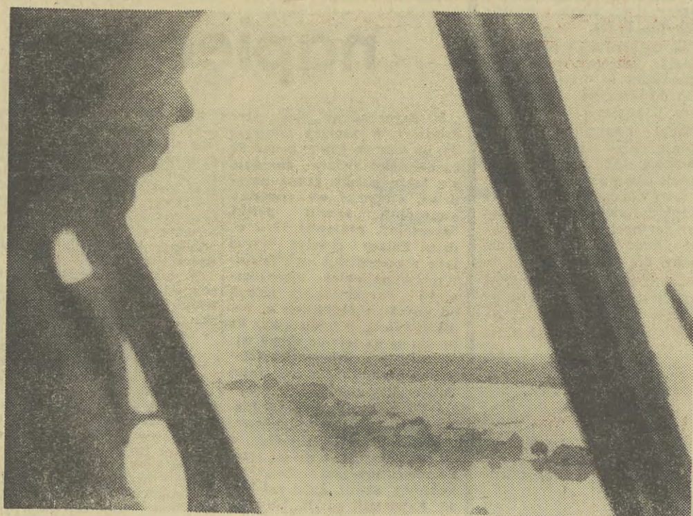
W północnej części pow. bocheńskiego Wisła zalala wsie, pola uprawne i laki.

W niektórych powiatach odwołano alarm powodziowy Wstępny bilans strat ■ Skuteczna pomoc dla ludności