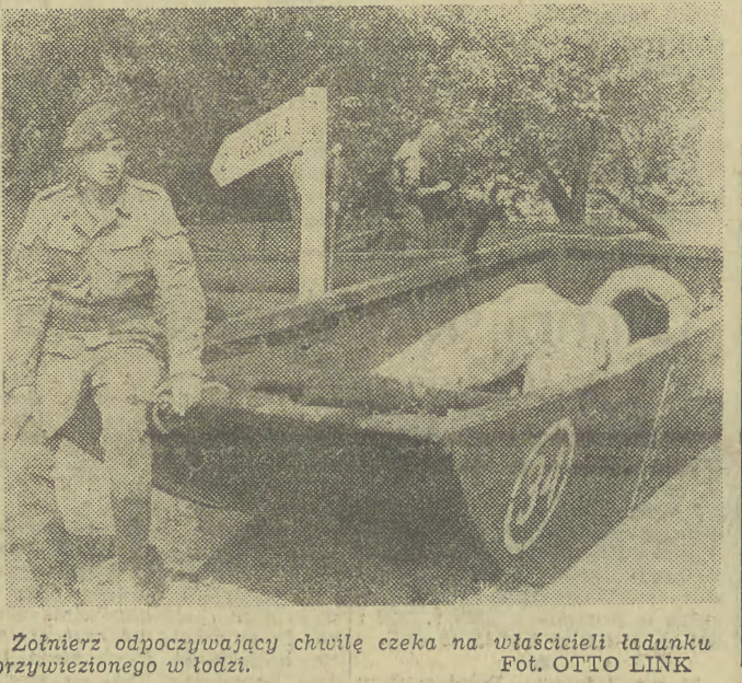
Zolnierze odpoczywający chwilę czeka na właścicieli ładunku przywiezionego w łodzi.

PROLETARIUSZE WSZYSTKICH KRAJÓW ŁĄCZCIE SIĘ!