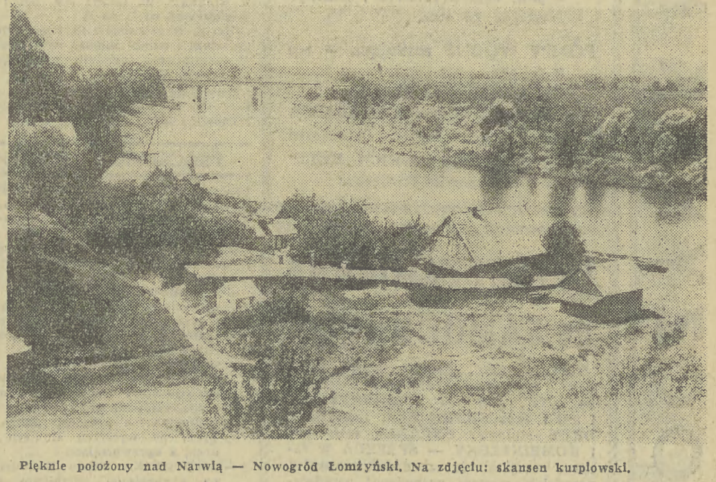
Pięknie położony nad Narwią — Nowogród Łomżyński. Na zdjęciu: skansen kurpiowski.