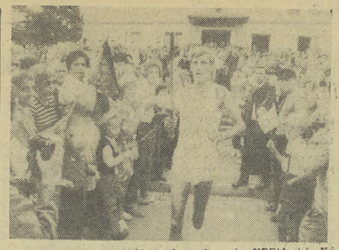
Wczoraj znicz olimpijski przekroczył granicę NRF/Austria. Na zdjęciu: lekkoatleta zachodniemiecki przekracza granicę w Freilassing.

ORGAN KW POLSKIEJ ZJEDNOCZONEJ PARTII ROBOTNICZEJ