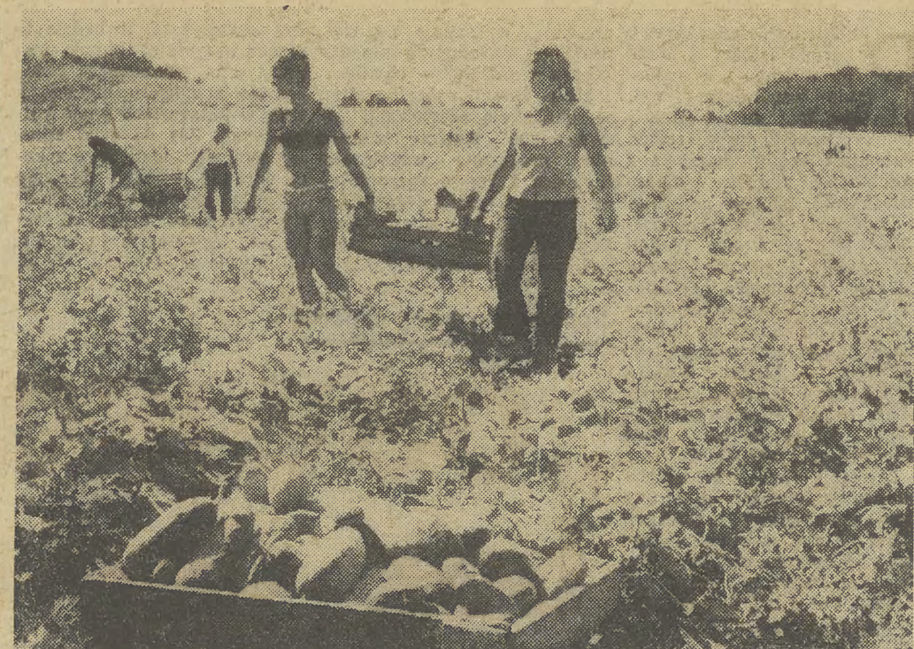
Na zdjęciu: dziesięć z roku zerowego olbrzymiej WSR przy zbiorze okrągów.