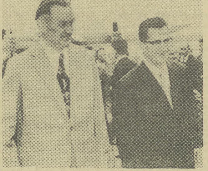
N/z: L. Sztrougal i P. Jaroszewicz podczas powitania na lotnisku.

PRAGA (PAP) Na zaproszenie przewodniczącego rządu CSRS, LUBOMIRA SZTROUGALA przybył do Czechosłowacji 16 bm. z wizytą przyjacieli prezes Rady Ministrów PRL — PIOTR JAROSZEWICZ z małżonką.