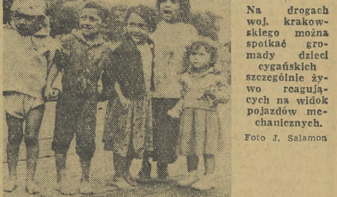
Na drogach woj. krakowskiego można spotkać gromady dzieci cygańskich szczególnie żywo reagujących na widok pojazdów mechanicznych.