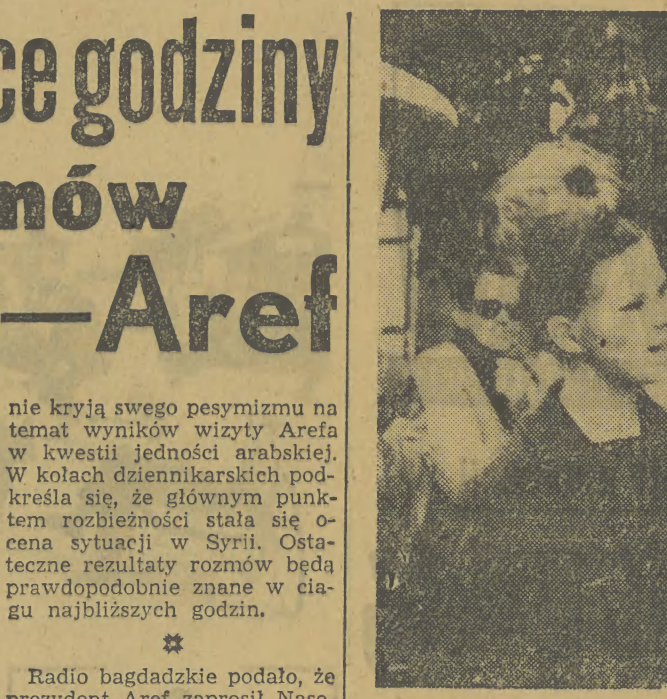
21 bm. Paryż był widownią wielkiej manifestacji przeciwko dyskryminacji rasowej w Stanach Zjednoczonych...