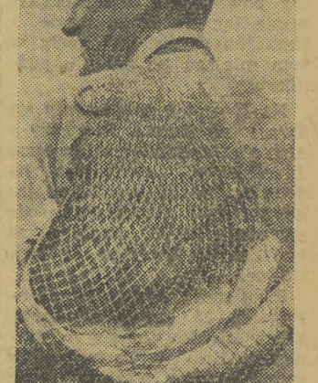
Gdy z polowu wraca się z takimi okazami, można mieć zadowolona minę.

Nieostateczny początkowo akcenty ironii stają się w końcu coraz silniejsze, wyrażają się, przebiegają w drwinie i szyderstwie: