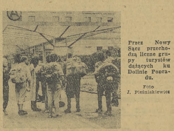
Przez Nowy Sącz przechodzą liczne grupy turystów dążących ku Dolinie Ponoru.