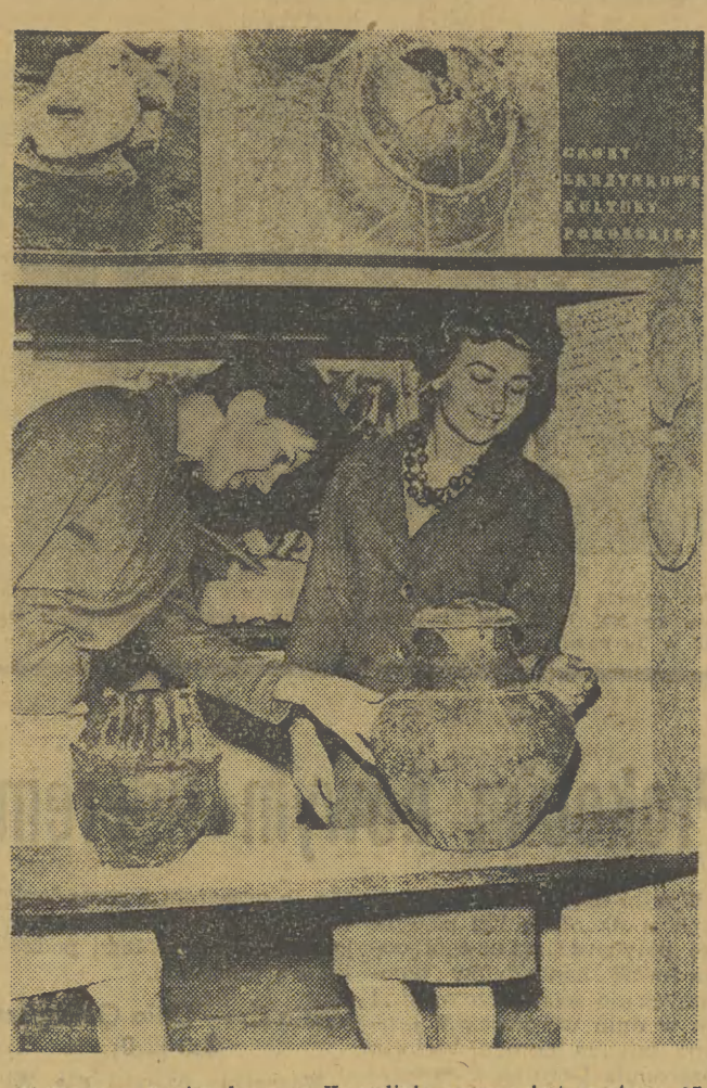
W Muzeum Regionalnym w Koszalinie czynna jest wystawa archeologiczna, na której zgromadzone ciekawe eksponaty pochodzące z wykopalisk na terenie Pomorza. Na zdjęciu: prasłowiańskie urny.

— No, cóż — powiedział, gdy został sam z Madaejem — Chłopak zdał egzamin celując. Pamiętał nawet o książce, mimo że trzy godziny temu została usunięta z pola jego widzenia. Świadczy to o jego widzeniu. Świadczy to o jego widzeniu.