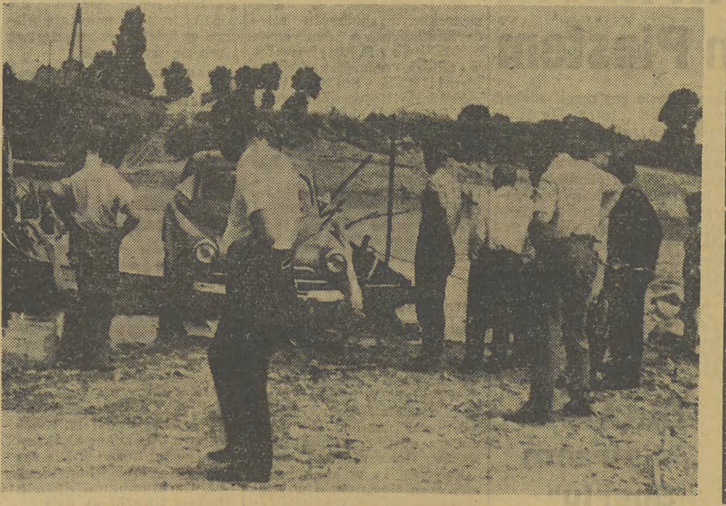
Fot. T. Leśniak

Do Wietrzychowic trzeba przeprawić się promem. Fot. T. Leśniak