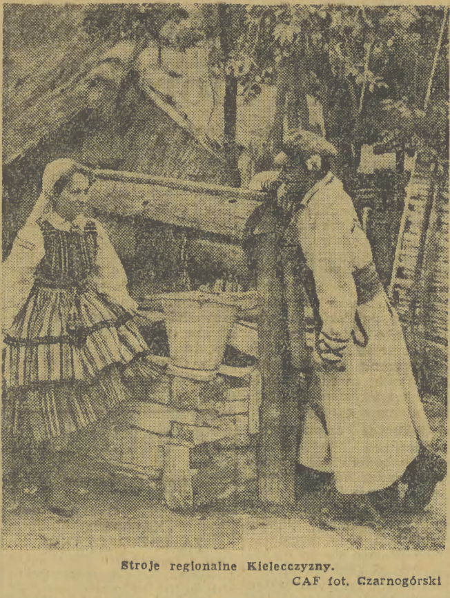
Strój regionalny Kielecczynny.