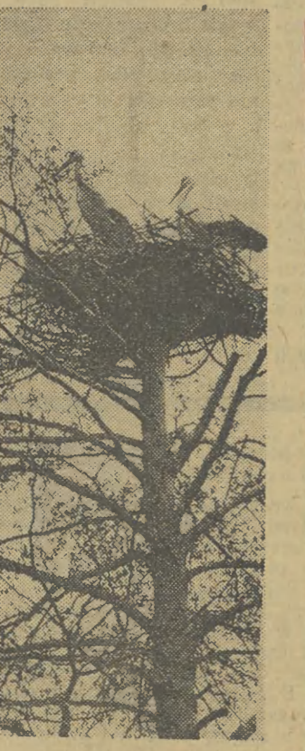
Boclanie gospodarstwo, CAF — Miedza