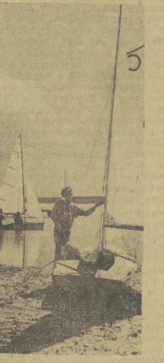
PRZED SEZONEM ŻEGLARSKIM Przystań nad jeziorem Jamno, CAF — Dąbrowicki

W jesieni ub. roku restauracja „Zajazd” mieszcząca się na Złotej Górze nad Oicowem, otrzymała w ogólnopolskim konkursie na najlepszą prowadzoną zakład gastronomiczny, zaszczytne wyróżnienie tzw. „Srebrną Patelnię”. Równocześnie milicja zainteresowała się bliżej „Zajazdem”. Wydział do walki z przestępczością gospodarczą zarządził przeprowadzenie inspekcji i rozliczenia działalności restauracji „Zajazd”. Przeprowadzili ją inspektorzy PIH. Oficerowie dochodzeniowi uszczęśli śledztwo.