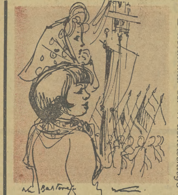
Z notatnika A. Wasilewskiego

Wszystkie te źródła przestępczej działalności można było zlikwidować w zarodku. By zostały ujawnione — wystarczyła sumienna kontrola.