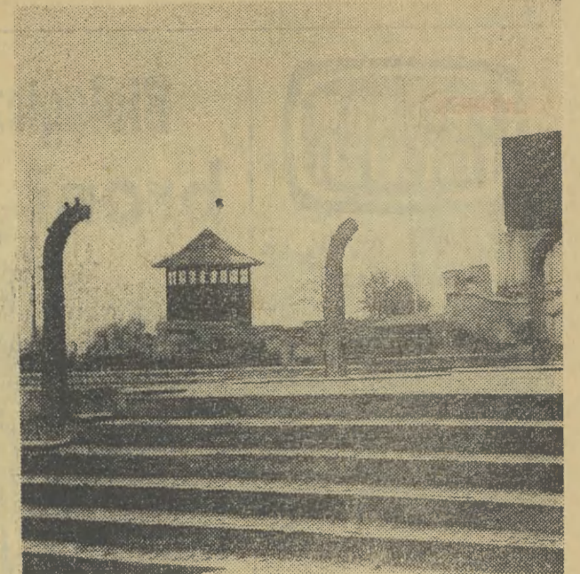
W niedzielę 16 kwietnia br. nastąpi odsłonięcie wielkiego pomnika na terenie byłego obozu w Brzezynie — ku czci 4 milionów ofiar hitlerowskiego faszyzmu. Wspomnieniom tych tragicznych wydarzeń poświęcamy szereg publikacji wewnątrz dzisiejszego numeru.