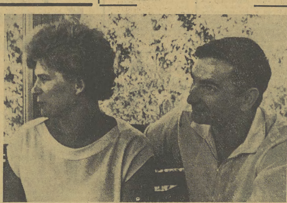
Walentyńska Tierieszkowa i Walery Bykowski na kosmosdronie.

A oto krótki wykaz najatrakcyjniejszych z punktu widzenia potrzeb rynku wewnętrznego zakupów: w Anglii nabyliśmy m. in. partie wełny, orlonu i jedwabiu