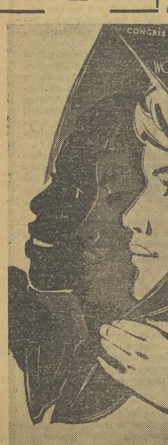
MOCKBA 24-29 VI 1963