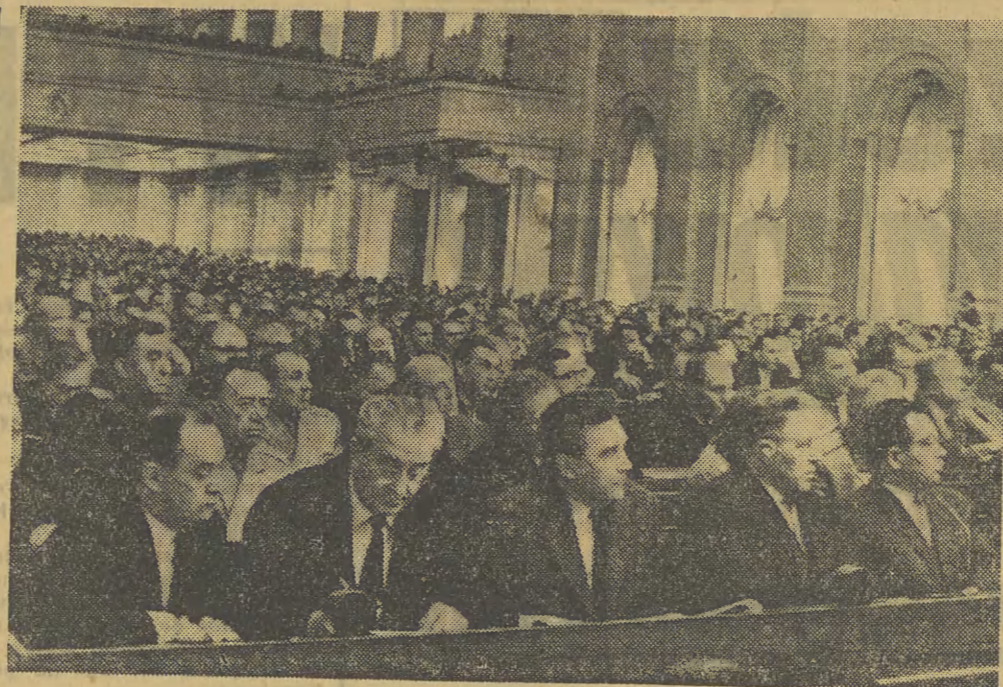
Ogólny widok sali podczas obrad Plenum KC KPZR, które rozpoczęło obrady 18 bm. w Moskwie.

RIO DE JANEIRO (PAP). Dowódcą lotnictwa chilijskiego podał we wtorek, iż rozbił się wojskowy samolot chlijski. 16 osób załogi i pasażerów poniosło śmierć.