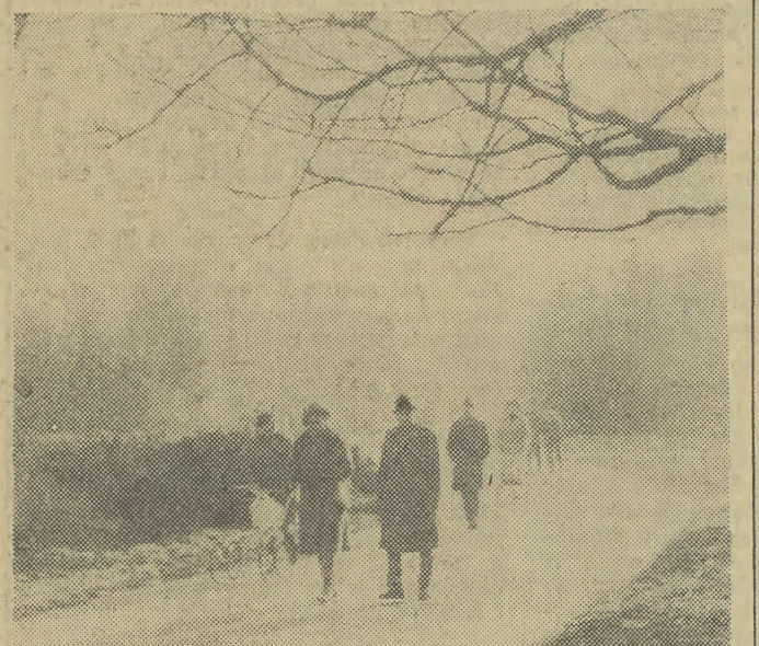
Mglista deszczowa jesień jak nigdy dotąd wygrywa pojedynek z zimą, za którą tęsknią już wszyscy. A że zdarzają się momenty, gdy deszcz przestaje padać, więc alejki parku Jordana odwiedzane bywają przez licznych spacerowiczów.

Nieprawdą jest jakoby Złota Sala Filharmonii została przeznaczona na „kawiarnię”. W Filharmonii uruchomiono, w innym zresztą „omieszczeniu”, bufet. Służą on tak koncertowej publiczności, jak i kilkunastu osobom zespołu muzyczny w przerwach jego trudnej pracy. Jest to sala mała, która nie pomieszczyłaby żadnego zespołu i w której nigdy prób nie odbywano. Może ona służyć co najwyżej dla zespołów klubowych, zebrań itp. (L.P.)