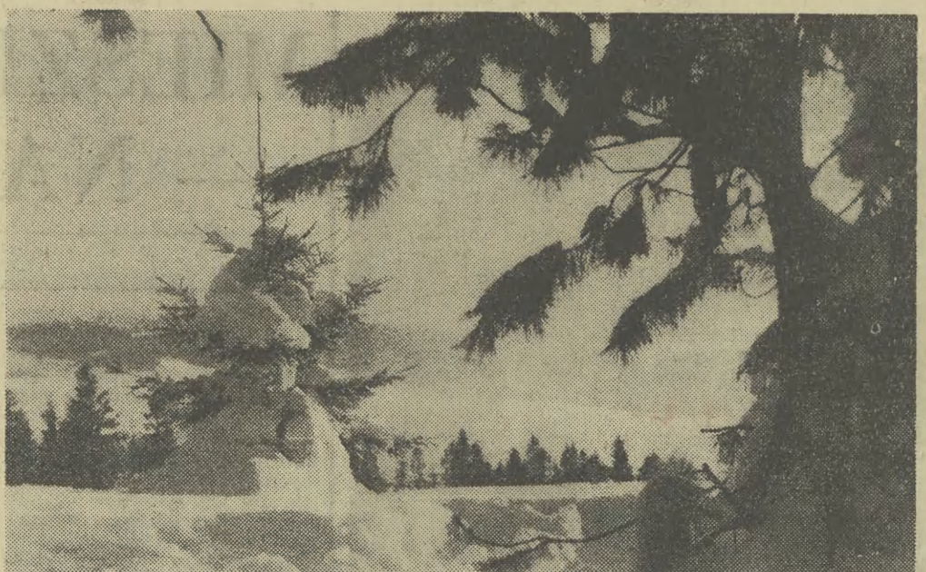
Tegoroczna zima spłatała na razie dużego figla narciarzom. Takie obrazy jak te widać na naszym zdjęciu można było spotkać tylko w wysokich partiach gór...