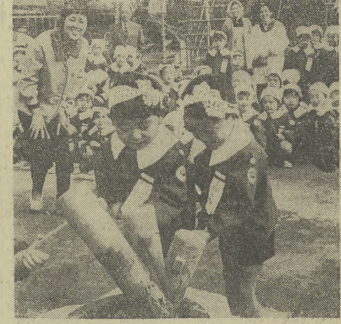
Tradycyjnym obyczajem japońskim w grudniu zaczyna się przygotowywanie ryżowych placzków na święto Nowego Roku. Młoi kucharze z tokijskiego przedziałka również zabrał się do roboty. Oto jak wyglądał ten obyczaj.