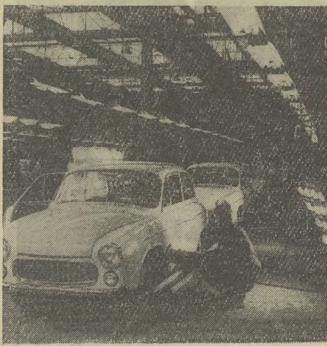
Wytwórnia Sprzętu Mechanicznego w Bielsku Białym przeprowadza już doświadczenia montażu samochodu osobowego marki „syrena 104”.

— Widzi pani, to jest tak. Ja pracuję jako mistrz i mam wiele obowiązków zawodowych, bo mistrz to w zakładzie ważna figura, bez jego dobrej pracy wiele może się zawalić. Ale ostatnio wybrano mnie właśnie sekretarzem oddziałowym PZPR i nagle na moje plecy spadło mnóstwo dodatkowych obowiązków. Jako mistrz zawsze miałem dobrą opinię i uważany był przez kierownictwo za jednego z lepszych. A tymczasem odkąd zostałem se-