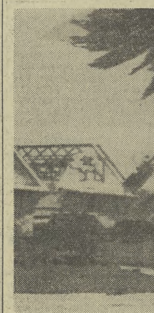
Gwałtowny cyklon przeszedł w sobotę nad miastem Townsville w północnej Australii. Co najmniej 3 osoby poniosły śmierć, a ponad 100 zostało rannych. 1000 domów zostało uszkodzonych — większość spośród 70 tys. mieszkańców miasta musiała spędzić święta w szkołach i innych budynkach publicznych. Na zdjęciu: zniszczone domy i polamane drzewa w Townsville.

Ten bogaty plon musi być możliwie jak najszybciej uwzględniony w codziennej praktyce wszystkich ogniw budownictwa, w planach ich długofalowego działania. Nad przygotowaniem programu realizacji uchwały Zjazdu wprowadzenia w życie najważniejszych zgłoszonych wniosków (DOKOŃCZENIE NA STR. 2)