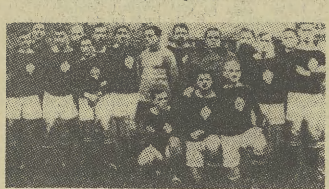
Piłkarska reprezentacja Polski, która 18 grudnia 1921 r. rozegrała w Budapeszcie mecz z Węgrami...