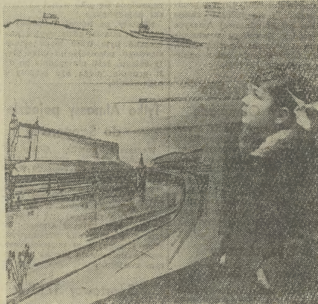
Szczecińscy dyskutują nad rozwiązaniem architektonicznym Osi Odrzańskiej, która w przyszłości ma być wytyczką tego największego miasta portowego na Wybrzeżu Zachodnim. Ostatnio rozstrzygnięty został konkurs na projekt zabudowy tego rejonu miasta. Oś Odrzańska rozciągająca się wzdłuż Odry od Dworca Kolejowego do Dworca Morskiego obejmuje rejon ulicy Wielkiej, Podzamcze, Wały Chrobrego, oraz przelieży brzeg rzeki. Obecnie w Zamku Książąt Szczecińskich trwa wystawa nagrodzonych prac. Na zdjęciu: najmłodsi szczecińscy także interesują się wyglądem swego rodzinnego miasta w przyszłości.