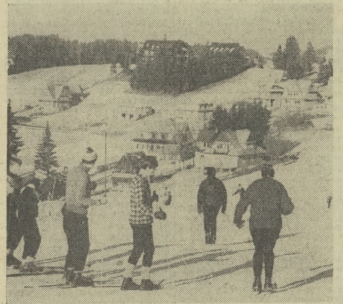
Święta w całym kraju upłynęły pod znakiem jesiennej aury, ale w Bukowinie Tatrzańskiej można było jednak jeździć na nartach.

PARYŻ (PAP) Niemal od stu lat nie było w stolicy Francji tak ciepłej pogody pod koniec grudnia, jak w tym roku. W piątek termometr wskazywał plus 10 stopni. Ciepło było w tym dniu również w innych stolicach. W Londynie temperatura w południe, podobnie zresztą jak i w sobotę, wynosiła 11 stopni C., przy czym na ogół było słonecznie. Zadna pogoda panowała także w Rzymie; notowano tam w południe 8 stopni. W Berlinie było pochmurno i temperatura w piątek sięgała 6 stopni. W pierwszy dzień świąt, podobnie jak w Warszawie, było pochmurno i mżył drobny deszcz, a temperatura w południe wynosiła 8 stopni.