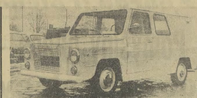
W dniach VI Zjazdu zaprezentowano po raz pierwszy trzy propozycje specjalnych samochodów dostawczych dla rolnictwa (przed wszystkim dla gospodarstw indywidualnych). Na zdjęciu: wykonany w Poznaniu samochód „tarpan”.

Wielką stała się ranga badań psychologicznych, podstaw szeroko rozumianej dydaktyki na wszystkich szczeblach. I na tym terenie nie brak naszego krakowskiego ośrodka. Duże nadzieje można pokładać w badaniach nad strukturą działania i optymalizacji procesu pracy. I tutaj jesteśmy obecni.