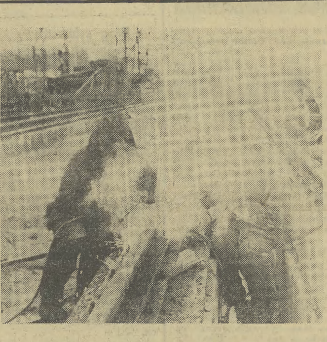
Na Nabrzeżu Górników w Swinoujściu trwa drugi etap budowy bazy przeładunkowej węgla. Na zdjęciu: robotnicy spawają szyny i podkładki pod wyładawarkę węgla.

Podjęcie przez radzieckie stacje automatyczne „Mars-2” i „Mars-3” kompleksowych badań naukowych stanowi jeszcze jeden istotny krok otwierający nowe możliwości na drodze do poznania tajemnic przyrody. Obie stacje marsjańskie prowadziły regularne badania przestrzeni międzyplanetarnej w trakcie lotu. Uzyskano bardzo wiele danych które są obecnie opracowywane. Niektóre z nich podano do wiadomości publicznej. Pomiary promieni podczerwonych umożliwiają uzyskanie danych dotyczących temperatury powierzchni Marsa. Na odcinkach, na których dokonywano pomiarów, temperatura nie przekraczała 15 stopni C. Interesujące jest przy tym, że na tej stronie planety, na której panowała noc, wykryto punkt, którego temperatura była o ok. 20-25 stopni C wyższa od temperatury powierzchni otaczającej. Istoty tego zjawiska nie udało się dotychczas wyjaśnić. Pomiary pary wodnej wykazały że — zgodnie z oczekiwaniami — w atmosferze Marsa ilość wilgoci jest bardzo niewielka. W punktach, w których dokonywano pomiarów, nie przewyższała ona warstewki wody grubości 5 mikronów, a więc setki tysięcy razy mniej, niż w atmosferze ziemskiej. Ustalono też, że atomy tlenu występują w atmosferze Marsa do wysokości 700-1000 km, natomiast atomy wodoru — do wysokości 10-20 tys. km.