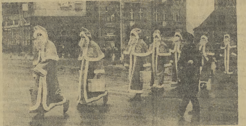
Widok aż siedmiu Mikolajów naraz oznacza, że nasz handel znajduje się w światowej ofensywie. Zyczymy więc miłych i dobrych zakupów.