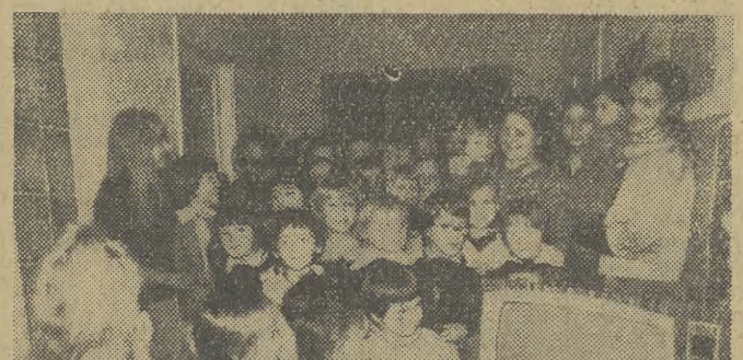
Uścieszliwione dzieci z Domu Dziecka przy ul. Piekarskiej 4 oglądają nowy telewizor.

Ostatnio 125 dziewcząt, od przedszkolaków do 20-letnich panienek, otrzymało nowy odbiornik telewizyjny marki „Granit 101”. Prezent został przyjęty z wielką wdzięcznością, a dziewczynki serdecznie dziękowały przedstawicielom zespołu „Gazety”. Dla dziennikarzy usmiech na twarzyczkach dzieci był wielką satysfakcją.