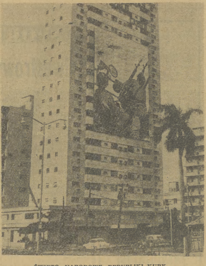
ŚWIĘTO NARODOWE REPUBLIKI KUBY Dekoracja uliczna w Hawanie przed świętem narodowym — VIII rocznicą rewolucji.