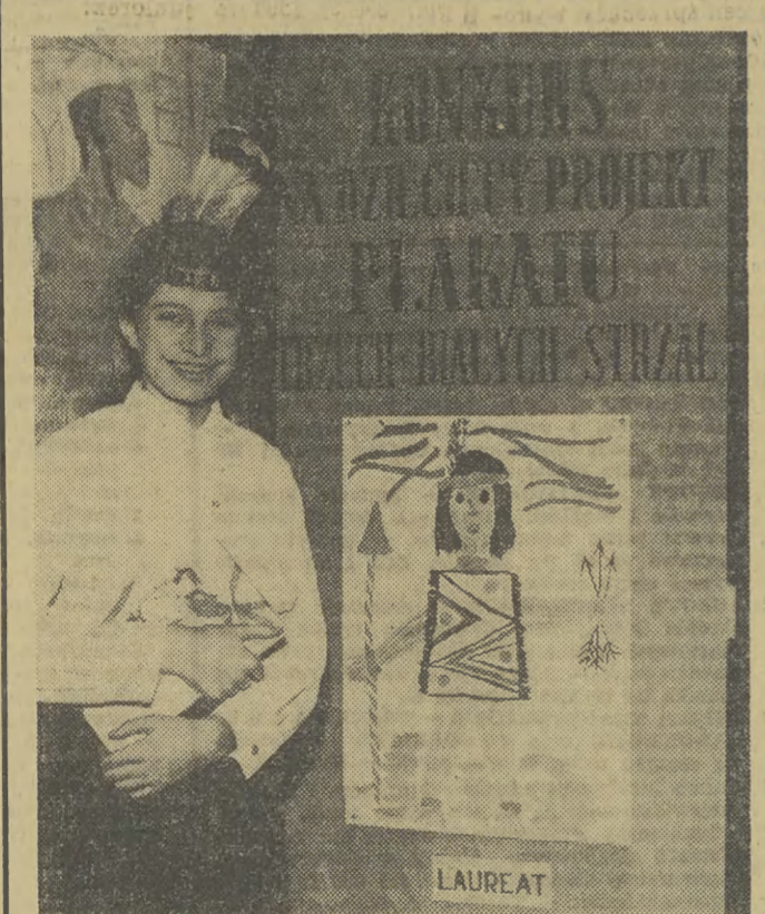
Hotel „Warszawa” w przedwojennym tzw. „drapaczu chmur”. Obecnie zdystansował go nie tylko Pałac Kultury, ale także wieżowiec przy Ścianie Wschodniej ul. Marszałkowskiej. Po prawej stronie — Dom Chłopa. CAF — Szyperko

Na zdjęciu: młoda laureatka. CAF — Szyperko