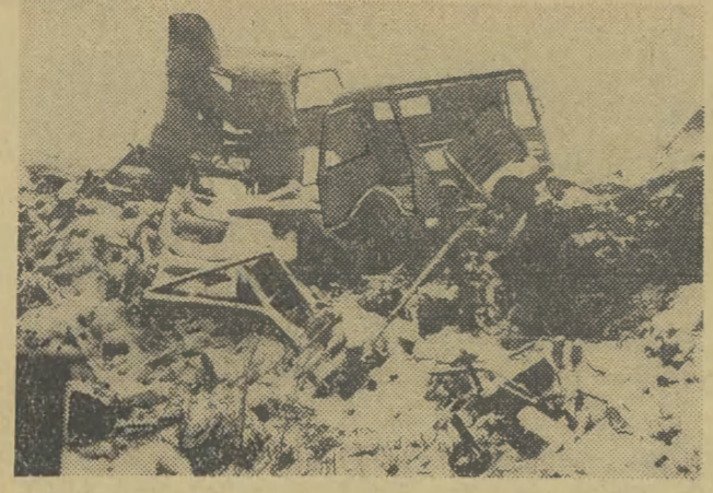
Tu się sumują najtragiczniejsze w skutkach wypadki drogowe. W zbiornicy złomu na Białym Pradniku samochodowe wraki czekają na przemiał w hutniczych piecach.

To co jednak zainteresuje najbardziej publiczność — ceny pozostają, jak zapewnicie dziennikarzy na specjalnej konferencji — niezmiennie.