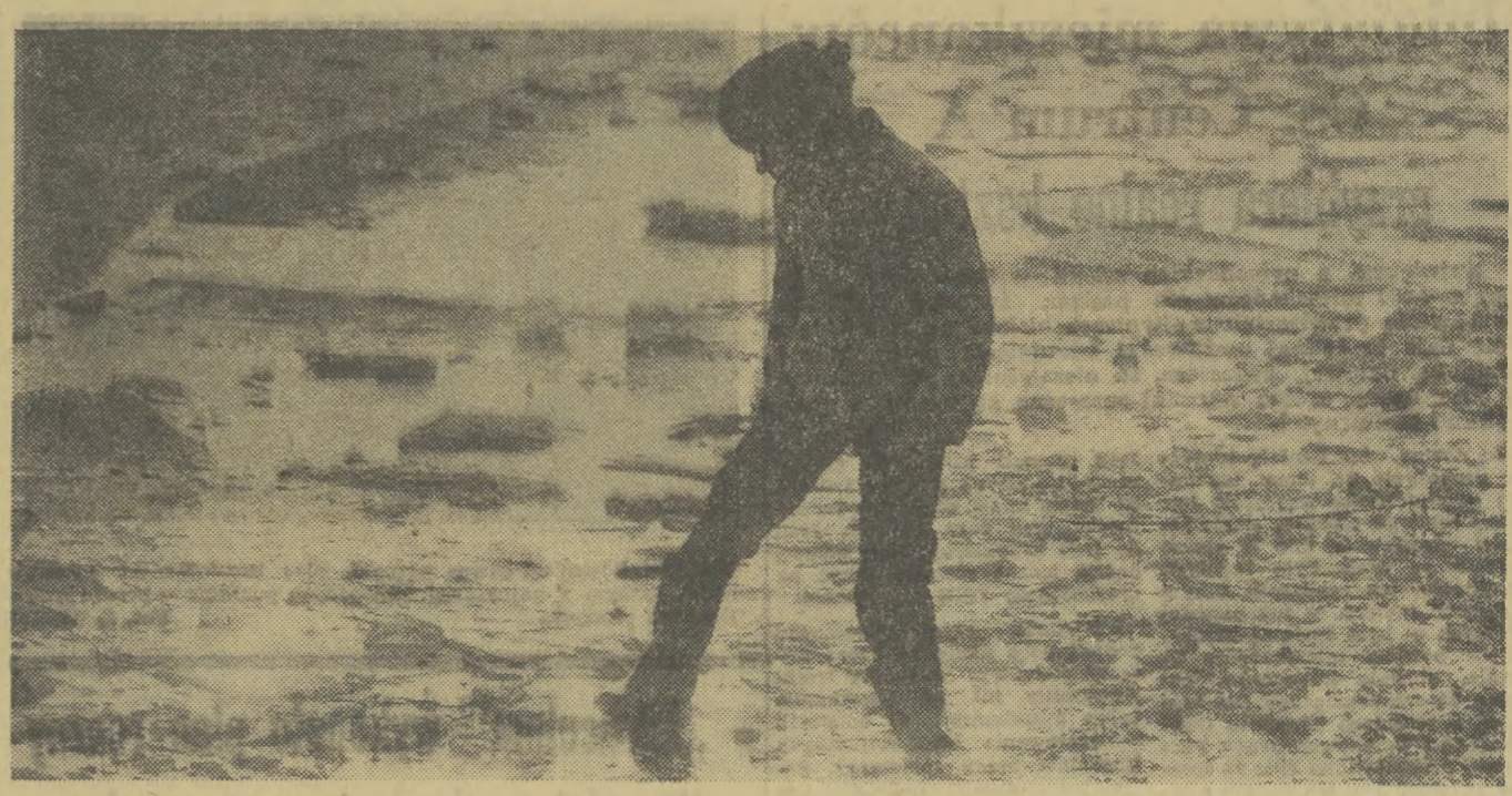
Zima nieśle uroki, ale jest też zapowiedzią tragedii. Pod cienkim lodem giną dzieci. Uważajmy na nie!