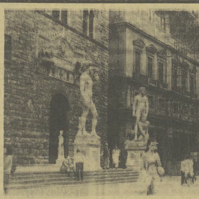
Wejście do Palazzo Vecchio.