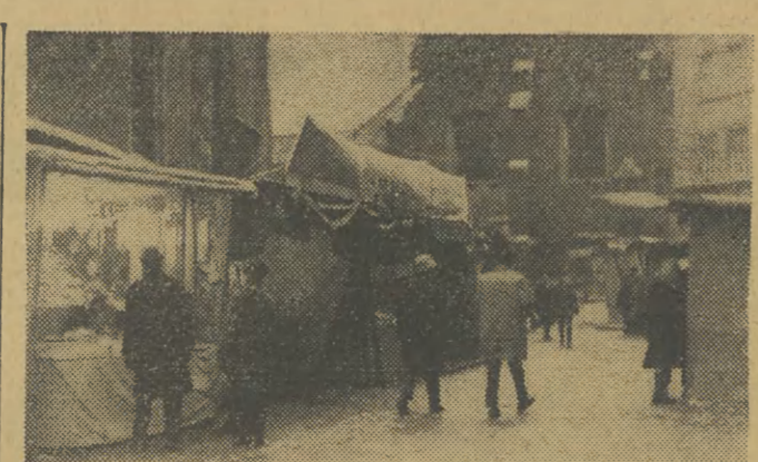
Na Placu Marlackim rozładują się kramy z towarami „świętymi”. Trochę to przypomina małomiasteczkowe Jarmarki...

Złe warunki bhp panują w większości zakładów pionu spółdzielczego i przemysłu terenowego. Na