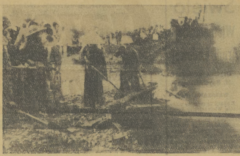
Wietnamskie kobiety - mieszkanki zombardowanej przez amerykańskich pilotów powiatowej dzielnicy Hanoi pracują przy uprzątku ulic.

Koła paryskie są przekonane, że u podstaw propozycji amerykańskiej leży postępująca wrogość świata wobec polityki USA i spadek popularności Johnsona.