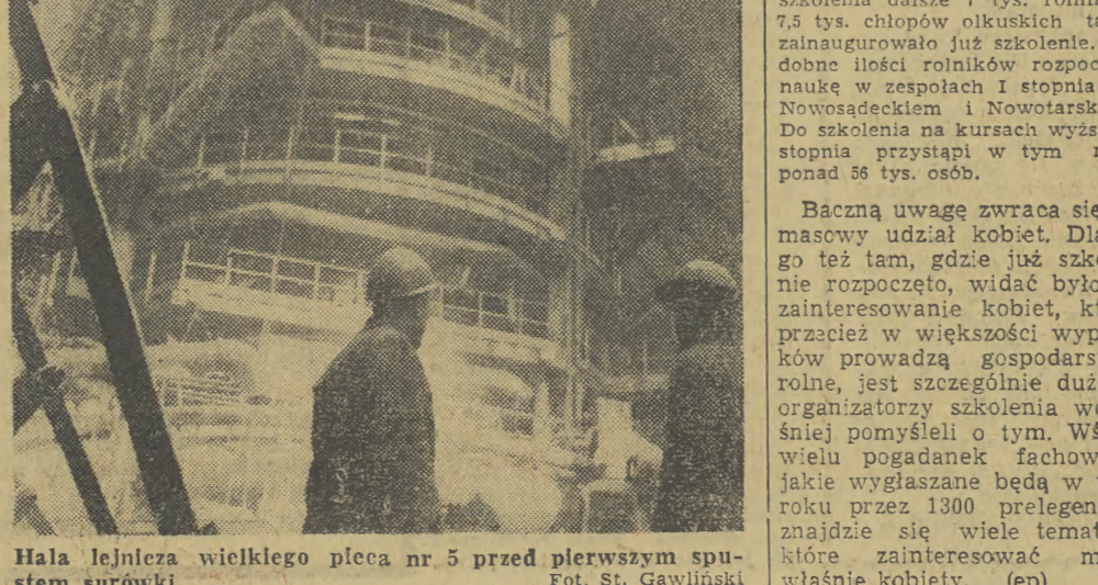
Halla leżnica wielkiego pieca nr 5 przed pierwszym spuštěm surowców.