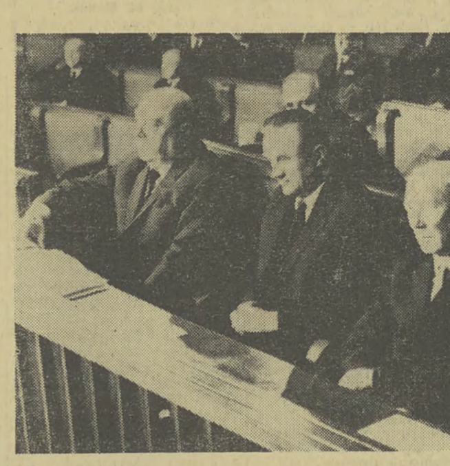
Przewodniczący Rady Ministrów ZSRR Aleksiej Kosygin udaje się we wtorek z wizytą oficjalną do Turcji.