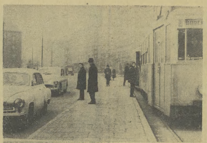
W efekcie trwającej przebudowy skrzyżowania przy Placu Wolności, powstała wyspka dla pieszych oczekujących na tramwaj, likwidującą tym samym jeszcze jeden punkt kolizyjny.

APOLLO: Markiza Angelika (fr.-wl.) 16 lat — 10, 12, 13, 14, 15, 16, 17, 18, 19, 20, 21, 22, 23, 24, 25, 26, 27, 28, 29, 30, 31, 32, 33, 34, 35, 36, 37, 38, 39, 40, 41, 42, 43, 44, 45, 46, 47, 48, 49, 50, 51, 52, 53, 54, 55, 56, 57, 58, 59, 60, 61, 62, 63, 64, 65, 66, 67, 68, 69, 70, 71, 72, 73, 74, 75, 76, 77, 78, 79, 80, 81, 82, 83, 84, 85, 86, 87, 88, 89, 90, 91, 92, 93, 94, 95, 96, 97, 98, 99, 100. KINA W NOWEJ HUCIE: SWIT: Nie przyszła mi kwiata (USA, 14 lat) — 15, 16, 17, 18, 19, 20, 21, 22, 23, 24, 25, 26, 27, 28, 29, 30, 31, 32, 33, 34, 35, 36, 37, 38, 39, 40, 41, 42, 43, 44, 45, 46, 47, 48, 49, 50, 51, 52, 53, 54, 55, 56, 57, 58, 59, 60, 61, 62, 63, 64, 65, 66, 67, 68, 69, 70, 71, 72, 73, 74, 75, 76, 77, 78, 79, 80, 81, 82, 83, 84, 85, 86, 87, 88, 89, 90, 91, 92, 93, 94, 95, 96, 97, 98, 99, 100.