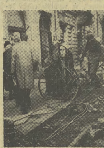
179 kwater prywatnych to zbyt mało

Jak się dowiadujemy, w najbliższą niedzielę — podobnie jak w latach ubiegłych — będą w Krakowie czynne wszystkie sklepy z wyjątkiem branży piekarniczej oraz monopolowej. Sklepy mają być otwarte od godz. 10 do 15. Natomiast zakłady gastronomiczne tak, jak w każdą niedzielę, w poniedziałek (19 bm.) będą otwarte, wszystkie sklepy mięsne i jak, jak w normalne dni tygodnia. Również od poniedziałku znosi się wprowadzone zarządzeniem MHW ograniczenia ilościowe w jednorazowej sprzedaży mięsa, wędlin i innych artykułów mięsnych. Wydział Handlu proponuje również, by uwzględniając popyt na artykuły owocowo-warzywne oraz świeże ryby, placówki handlowe organizowały dodatkowe stoiska wewnątrz oraz nazewnątrz sklepów.