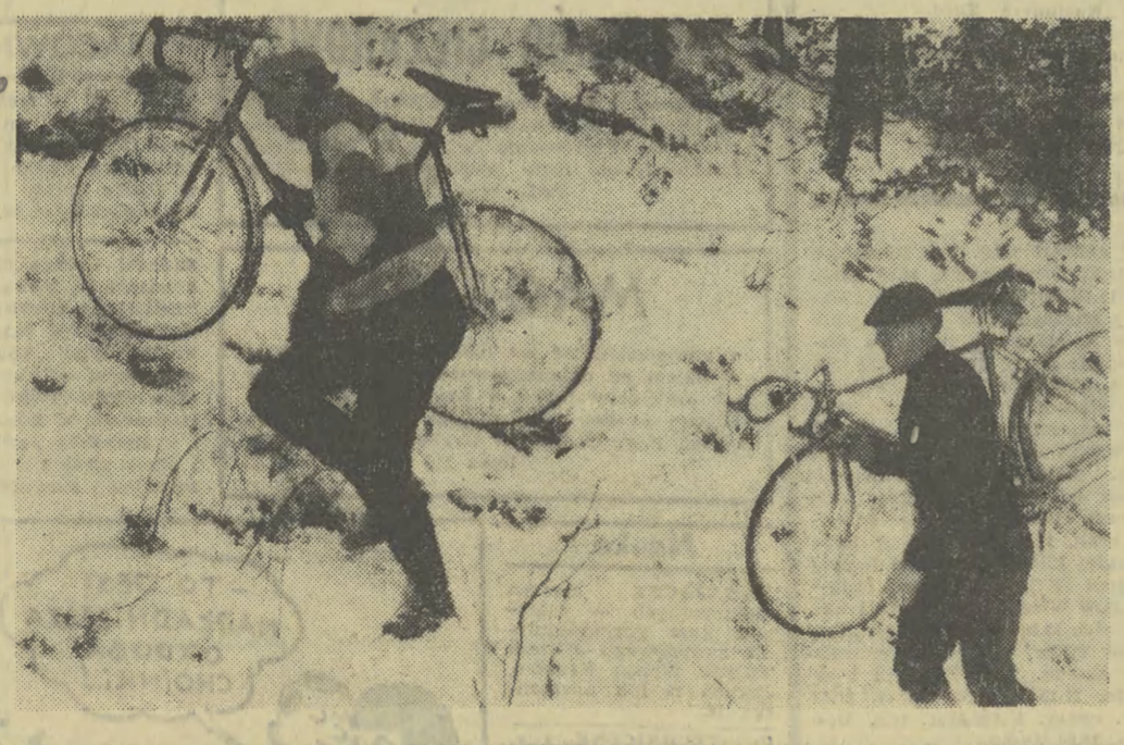
KOLARZE MYŚLA O MISTRZOSTWACH ŚWIATA W Oliwie przebywają na zgromadzeniu kadra olimpijska kolarzy. Piętnastu zawodników przygotowuje się do sezonu 1967 roku. Przechybiają tu młodzieńcy kolarze, którzy nie przekroczą 22 lat. Obóz treningowy trwać będzie do 20 bm.

NOTATNIK GOSPODARCZY Proporcje się udaly Plan na rok bieżący zakładał wzrost produkcji środków produkcji o 7,3 proc. zaś środków spożywczych o 5,4 proc. Wstępne szacunki wykazują tymczasem, że w toku wykonania planu nastąpiło nie zwiększenie a zmniejszenie rozpiętości pomiędzy dynamiką produkcji środków produkcji i środków spożywczych. Głównie zadecydowały o tym dobre zbory w rolnictwie, korzystnie rzutuujące m. in. na produkcję przemysłu mleczarskiego, warzywno-owocowego i mięsnego. Zona przyszłości Warszawskie Zakłady Radiotechniczne wypuściły na