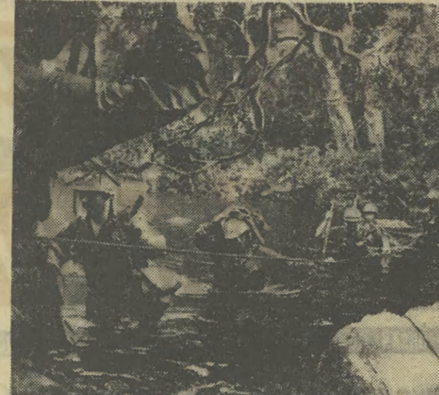
Patrol amerykański forsuje trudne przejście przez rzekę w dżungli południowowietnamskiej — podczas akcji poszukiwania kryjówek partyzanckich.

Berg zaleca rządowi NRF (dia zabezpieczenia tej stabilności ekonomicznej) ograniczenie „żądań socjalnych”, tj. wydatków na potrzeby społeczne i niedopuszczenie do dalszej podwyżki płac robotników i urzędników.